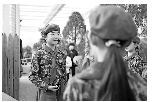
日前，光明小学的小志愿者解说员们走进沧州印象·大运河农业生态文化产业园，义务为参观者进行讲解，带大家感受大运河畔的风雅之美。