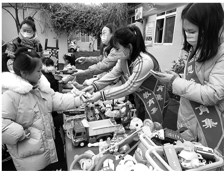
11月26日,金思维幼儿园运河区御河路校区举办了第五届“童心有大爱,善行暖三冬”感恩节义卖活动,师生共捐款5849元,由博爱人生公益基金会将爱心捐赠给贫困地区的家庭。

当天,在381省道出镇镇治超站,出警公路巡警中队3名执勤交警正在协助环保部门,对过往大型车辆进行尾气排放检测。其中,一辆号牌为晋C开头的大型货车尾气排放超标,执勤交警走近后,要求司机出示驾驶证。经过仔细查验,