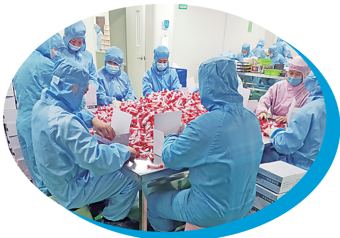
永康医药员工正在打包病毒采样管