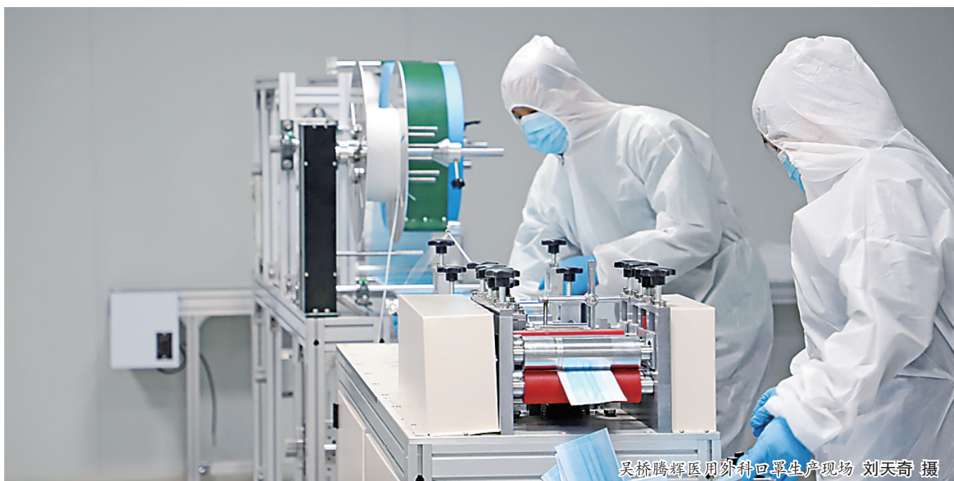
吴桥腾辉医用外科口罩生产现场