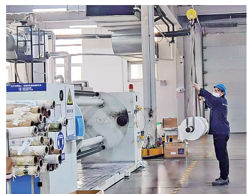
海德公司熔喷布生产车间