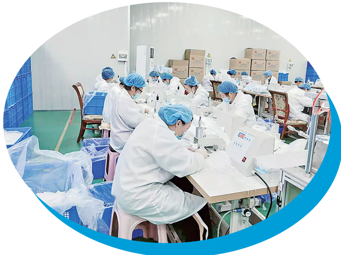
吴桥腾辉民用生产车间内员工在焊接耳带