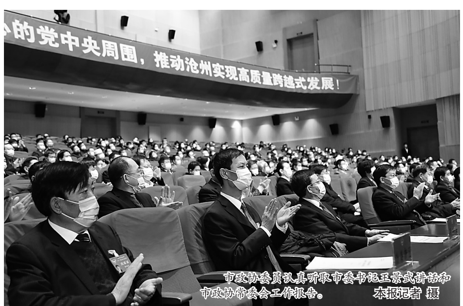
市政协委员认真听取市委书记王景武讲话和市政协常委会工作报告。

心的党中央周围，坚持以习近平新时代中国特色社会主义思想为指导，不忘初心、牢记使命，凝心聚力、真抓实干，为加快推动沧州高质量跨越式发展，奋力开创新时代全面建设经济强市、美丽沧州新局面作出更大贡献。” 市委书记王景武的讲话振奋人心，极大地鼓舞了政协委员们的士气，也开启了做好新一年政协工作的崭新篇章。 随后，市政协副主席薛泽通代表沧州市第十一届委员会常务委员会作工作报告。 “发挥政治优势，确保党对政协工作的全面领导更加有力”“强化责任担当，助力夺取‘双胜利’更加有力”“服务全市大局，助推沧州高质量跨越式发展更加有效”……回顾2020年，硕果累累，收获满满。 “把牢政治方向，以更高的履职自觉助力沧州高质量跨越式发展”“聚焦主责主业，以更强的履职实效助力沧州高质量跨越式发展”“扭住中心环节，以更大的履职合力助力沧州高质量跨越式发展”……展望2021年，激昂澎湃，信心满怀。 台下委员们凝神静听，深刻领会，不时圈圈画画或是认真记录。每到精彩之处，掌声雷动，是肯定与鼓励，也是信心和期待。这一刻，大家的心里只有一个信念：不负重托，不辱使命，携手把沧州各项事业推进向前。