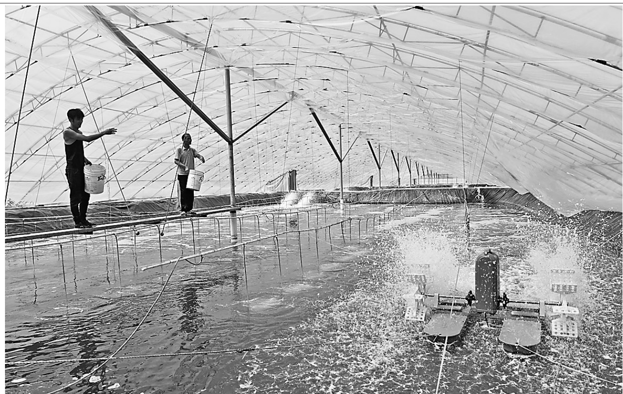
黄骅市渔业部门瞄准市场调结构,推动以水产育苗业、养殖业等为代表的现代渔业发展,引领渔民转产转业和产业转型升级。目前,黄骅市海水育苗养殖企业108家,直接提供就业岗位近5000个,年产值达8亿元,现代渔业成为渔民增收致富的“新引擎”。这是黄骅市渔民在大棚高位池为对虾幼苗投放饲料。

金支持;陆续推出住房公积金贷款“一次办”、查询提取缴存等高频业务全流程“网上办”、柜台业务零复印件“轻松办”、全市“通缴通提”就近办、住房贷款“组合办”、银行柜员机和手机银行“自助办”、部分业务“跨省通办”等便民举措,让缴存单位和职工办事更加便捷高效,满意度不断提高。