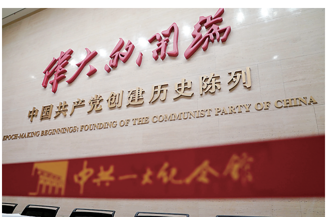
6月3日在中国共产党第一次全国代表大会纪念馆内拍摄的“伟大的开端——中国共产党创建历史陈列”。

据新华社上海6月3日电 位于上海市的中国共产党第一次全国代表大会纪念馆3日开馆，设有基本陈列“伟大的开端——中国共产党创建历史陈列”，党创建时期的红色文物得到“集结”展示。 中共一大纪念馆由中共一大会议会址、宣誓大厅、新建展馆等组成，新建展馆同为石库门建筑风格。新的基本陈列展厅面积超3000平方米，在馆藏12万件（套）文物和近年来从国际国内新征集档案史料中，纪念馆精选出612件文物展品，较原先基本陈列展出的文物数量大幅扩容。包括各类图片、艺术展项等在内的展品总量由原来的278件增至1168件。 展览共7个板块，分别为“历史选择 伟大起点”“前仆后继 救亡图存”“民众觉醒 主义抉择”“早期组织 星火初燃”“开天辟地 日出东方”“砥砺前行 光辉历程”“不忘初心 牢记使命 永远奋斗”，生动体现中国共产党的诞生和百年奋斗历程。 全新陈列亮点纷呈，其中，建党文物集中展示，新