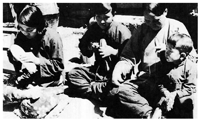
群众为抗日战士纳鞋底