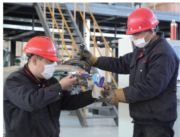
河北沧海核装备科技股份有限公司ODF高耐腐蚀化工管生产线正式进入量产阶段,这是盐山县管道装备制造企业转型的又一重点投产达效项目