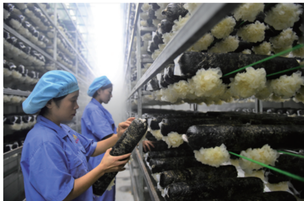
河北恩际集团沧州福农生物科技有限公司建设的银耳工厂化种植及深加工一体化项目成功投产运营,年产银耳深加工产品480吨,为银耳种植、加工、销售一体化全产业链经营模式,可吸纳150余名本地劳动力就业,并将辐射全县12个乡镇、450个村。