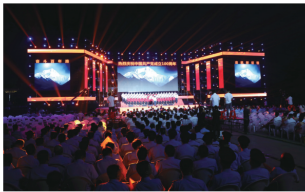
成功举办庆祝中国共产党成立100周年“永远跟党走”盐山县群众性歌咏大会