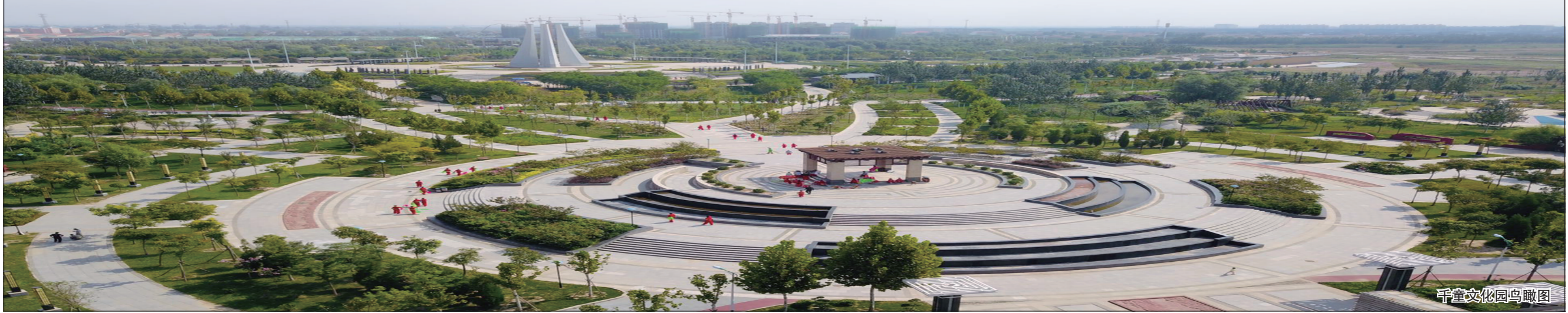
千童文化园鸟瞰图

过去五年,盐山县持续加大民生投入,实施积极的就业政策,重点群体就业得到更好保障。新增农村劳动力转移输出1.7万余人,城镇新增就业1.5万余人;273个创业项目入驻孵化基地,累计营业额近3亿元,纳税2900万元,带动就业1000余人,县人社局被授予“全国人社系统优质服务窗口”称号。大力推进全民医疗保险参保计划,参保率稳定在95%以上;城乡办学条件得到全面改善,建成泰安路小学、第六中学,启动了凤凰路小学、第七中学、第八中学等建设项目,投资8970万元实施“全面改薄”工程,提高学校配置水平,顺利通过“国家义务教育发展基本均衡县”认定,获评“河北省教育工作先进县”。严格控制大气污染,先后三年被评为省级大气污染防治工作先进县;坚持以城市化理念建设园区、管理园区、开发园区,累计投资9300万元,实施了绿化、亮化、美化、便道硬化、综合管网标准化“五化”工程,小微工业园、铭润工业园、军民融合产业园等特色“区中园”规模不断壮大,园区管理规范、标准化、制度化水平不断提升。