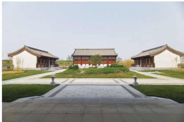
千童东渡遗址公园