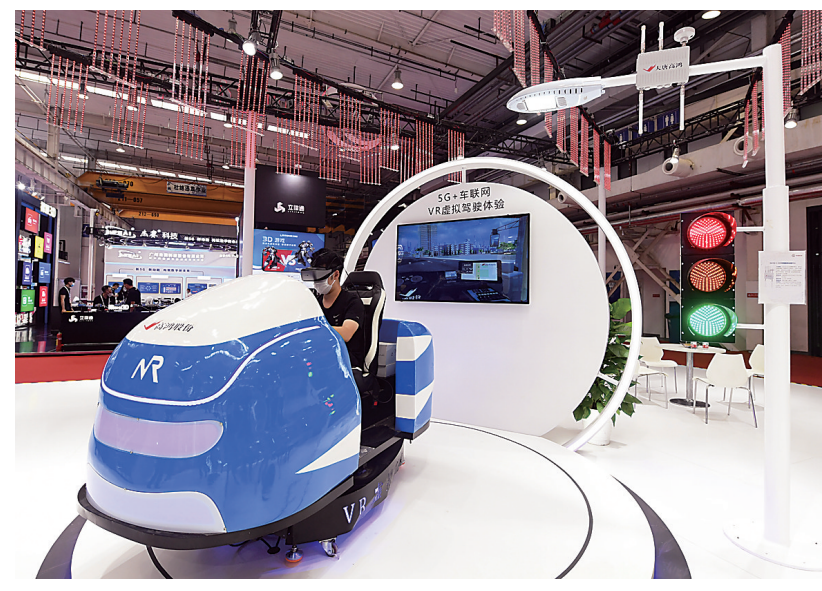
8月31日，在2021世界5G大会展览现场，媒体从业人员体验5G+车联网VR虚拟驾驶。当日，2021世界5G大会在北京开幕，本次大会的主题为“5G深耕 共生共赢”，包含会议论坛、展览展示和揭榜赛等内容。