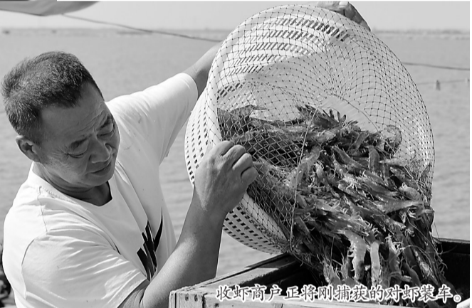
收虾户正将刚捕获的对虾装车。