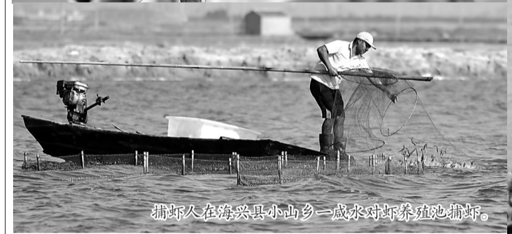
捕虾人在海兴县小山乡一咸水对虾养殖池捕虾。