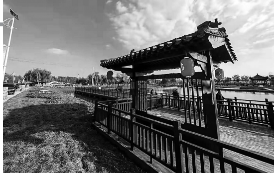
青县果蔬小镇风景

中有各种蔬菜创意景观，也可以研学体验，大大丰富了景区的功能和看点。青县中古红木文化小镇坐落于大运河青县段原流河驿遗址，规划占地面积3.6平方公里，主要由中国古典（红木）家具工艺体验区、中式（康养）生活体验区、特色生态农业观光体验区三大板块组成。小镇的核心板块，中国古典（红木）家具工艺体验区，已建成大运河红木文化馆、沿街精品展馆、滨水古玩一条街、标准化生产车间、红木文化城以及沿河红木商业街、前店后坊体验店等10万平方米，建成区完成“九通一平”及绿化美化亮化工程，签约入驻企业115家，入镇生产经营的38家。