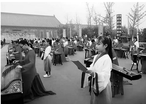
南皮县百名学生身穿汉服，在县文化展览中心弹奏古筝曲《南皮赋》

小镇集文化特色旅游、生态农业观光于一体，核心艺术区、文创文化区和非遗文化区，剪纸馆、陶瓷书画馆、泥塑馆点缀其中，瓷