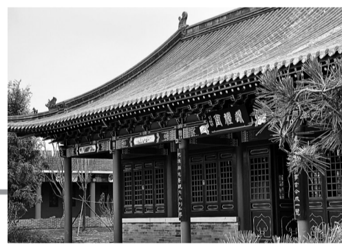
沧县御碑苑景点复建的巡礼堂

沧县御碑苑景区因乾隆御碑而得名，占地面积2.84公顷，景区以明清时期北方传统园林为基调，依托捷地水利枢纽和乾隆御碑为主要背景，形成水利工程与运河文化相互融合的水利人文景观，是“事在人为”精神的传承与见证之地。