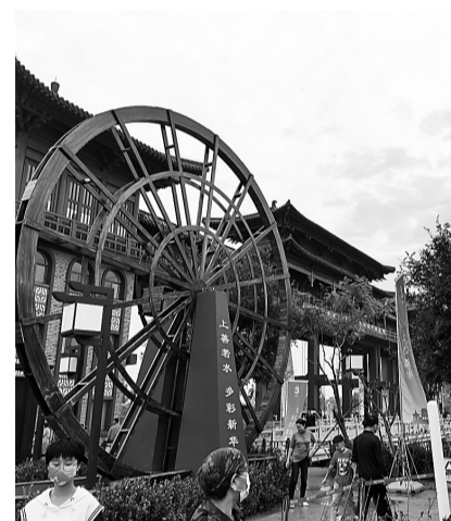
王希鲁闸水利研学公园一景

此外，新华区将南水北调应急输水重要控制工程之一的王希鲁节制闸与绵长的沧州文化、大运河历史巧妙融合，借助气魄宏伟、严整开朗的唐风楼阁，与现代科技人文、运河历史故事巧妙结合打造，引人入胜、扣人心弦。