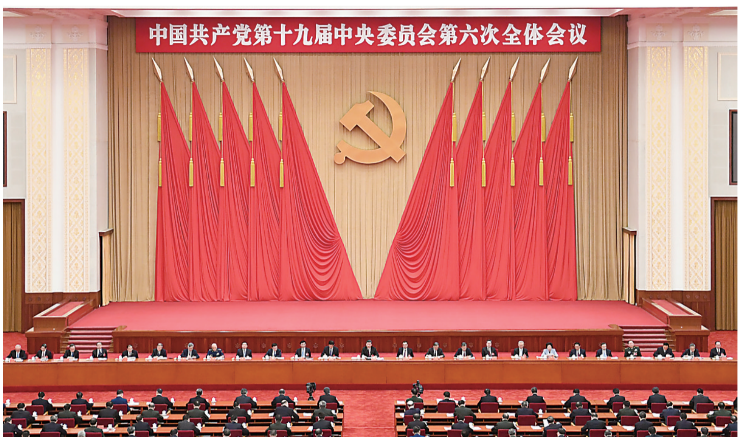
中国共产党第十九届中央委员会第六次全体会议在北京举行。