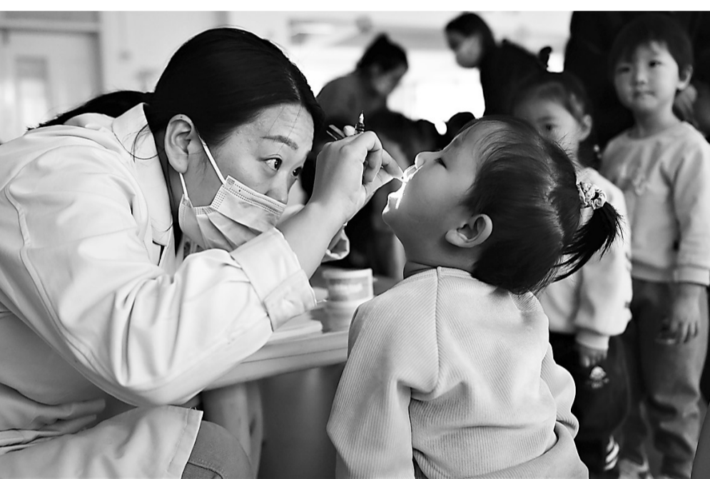
近日,沧州市妇幼保健院与运河区部分小学和幼儿园联合举办针对孩子视力与口腔的义诊活动,让家长及时了解孩子的视力和口腔健康情况,增强爱眼护牙的意识和能力,帮助孩子们从小养成科学爱眼护牙的好习惯。

个区域。A区为运河两岸景观带,主要包含3处码头、活动广场、荷花池、园路及景观绿化;B区为河心岛专类植物展区,主要包含百草园、百花园、百果园及诗经园;C区为2号主门区,主要包含广场、林荫树阵等;D区为沧州坊,主要包含商街建筑2.3万平方米,停车场及广场铺装;E区为各城市展园,主要包含1号主门、公共楔、主湖及沿湖布局的地级市展园,计划明年7月底完工。目前,A2区南北端地形打造基本完成,南端计划近日种植乔木,北端