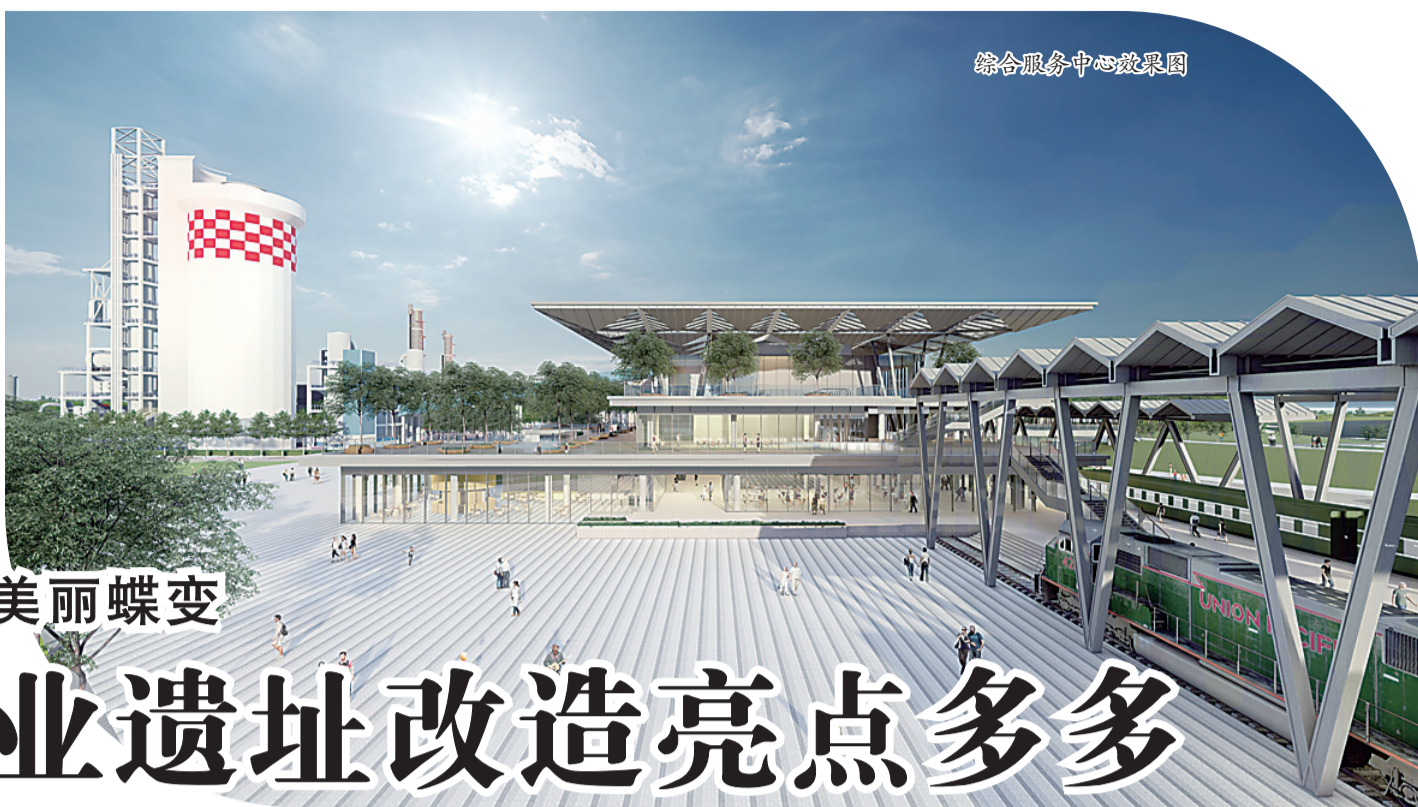
综合服务中心效果图