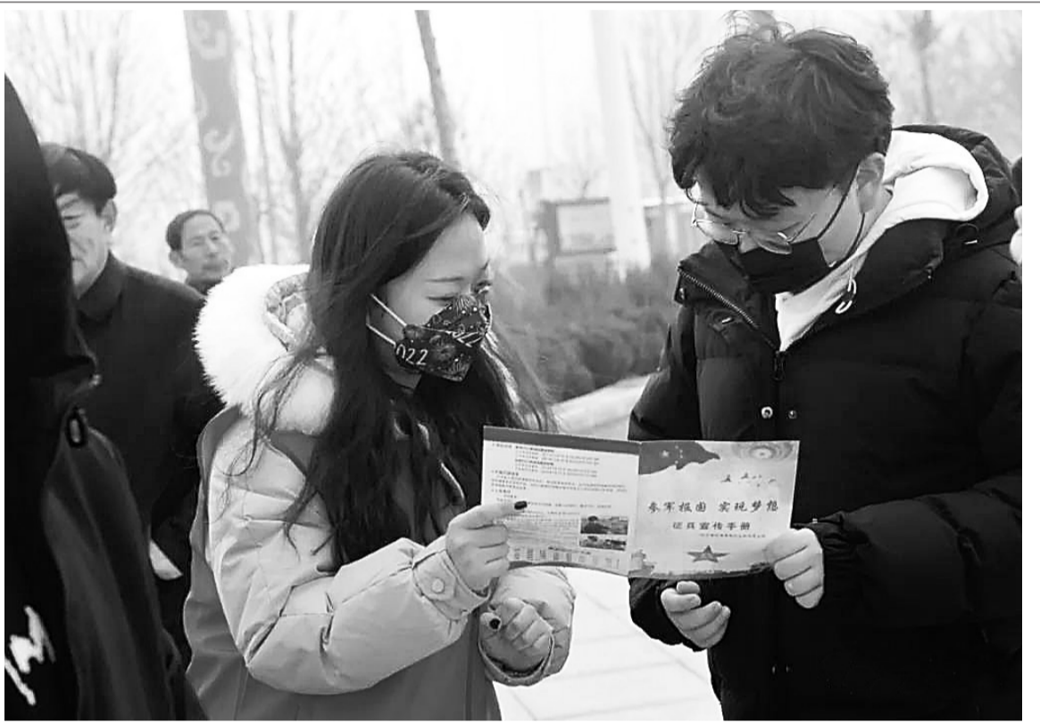
日前,在盐山县人武部、县总工会等部门的组织下,部分省市劳模、对越自卫反击战一等功臣、双拥模范以及爱心志愿者走上街头,通过悬挂横幅、出动宣传车等多种形式,把征兵政策送到千家万户,让更多家长和适龄青年全面了解征兵相关政策,鼓励广大热血青年响应国家号召,投身军营,报效祖国。

本报讯(记者申萍 通讯员肖青松)昨天,以“线上购好物、温暖团圆年”为主题的2022年沧州市年货节正式启动,为消费者带来“云上幸福年”年货大餐。 据悉,本次活动由商务局主办,市电子商务协会承办。活动时间为1月10日至2月7日,持续29天。本次活动通过线上全平台联动、直播带货、线下启动、发放市民消费券等多种宣传和促销形式,旨在抓好节日期间疫情防控的同时,让全市居民过一个祥和喜庆的春节。 活动包括“团圆年夜饭”“商超年货节”“年货直播购”三大板块活动。团圆年夜饭,为减少人员流动,鼓励市民群众在家吃团圆饭、年夜饭,指导饭店烹饪行业协会组织本地餐饮企业推出团圆饭、年夜饭外卖套餐,除传统线下门店销售以外,积极拓展微信公众号、小程序、外卖平台、直播电商等线上渠道,帮助市民“减少流动,美味不减”;商超年货节,联合建行沧州分行开展消费券投放活动,活动期间向市民发放500万元消费券,包含建行生活新人礼包、建行生活卡专属优惠券等。市民可通过“建行生活”平台领取消费券,到入驻建行生活平台的商场、超市、餐饮等门店使用或在线买单;年货直播购,通过河北广电网络集团线上平台,集合沧州本地年货类产品生产企业提供产品到直播间进行直播带货,初步选定第一批带货产品:火锅鸡、宫面、手工馒头、瓜子干货、酒类等。