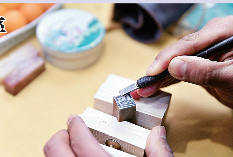
▲精美的文字 在刻刀下慢慢呈现