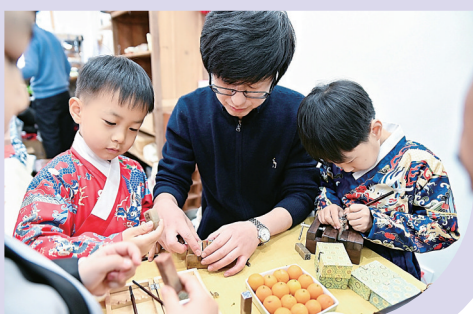
▶孩子们手握 刻刀用心雕刻