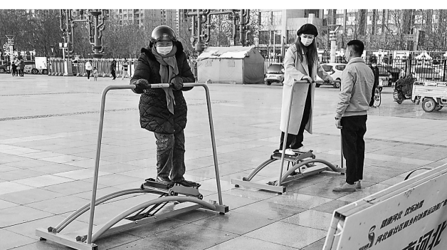
近日，任丘市矿山公园设置了冰雪体验器材，市民们在器材上模拟滑雪，享受冰雪运动带来的快乐。