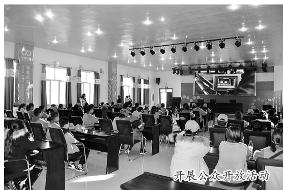
开展公众开放活动

2021年以来，面对肆虐不断的新冠肺炎疫情、国内外经济下行、国家产业及环保政策的压力，中节能沧州公司始终坚持做好常态化疫情防控，坚守安全环保底线，在内部管理、环保物料、设备检修、科技研发等多方面发力，充分克服生产运行困难，全面做好沧州市及周边生活垃圾处理工作。2021年共无害化处理生活垃圾69.81万吨，生产清洁电能1.9亿度，为积极推进沧州市生活垃圾减量化、无害化和资源化处置、节约土地资源、保护生态环境发挥了至关重要的作用。