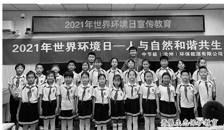
开展生态环保教育