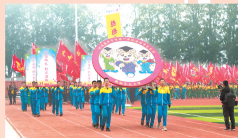
学校首届体育艺术节开幕式