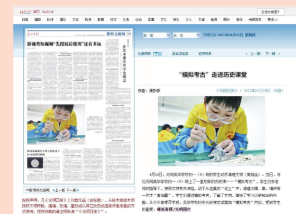
《光明日报》报道学校模拟考古进课堂活动