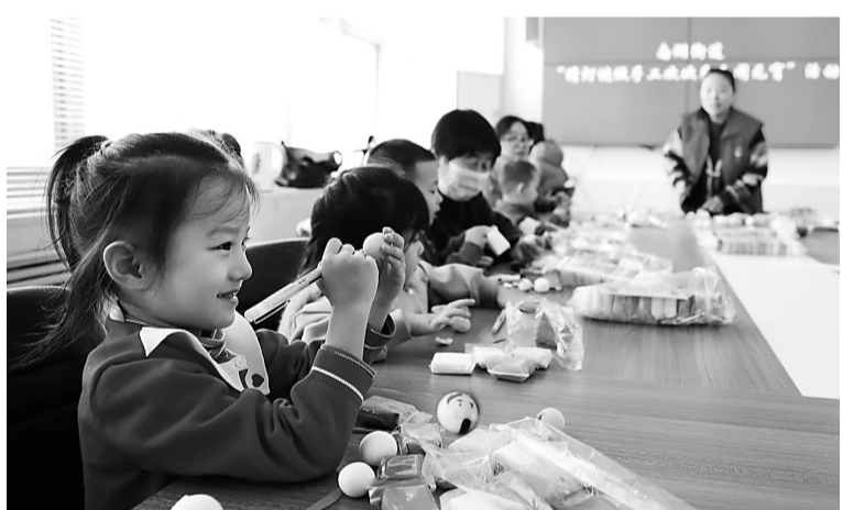
►运河区南湖街道办事处举办欢度元宵喜乐猜灯谜活动，社区人员与志愿者给孩子们讲述元宵节的来历等相关知识。