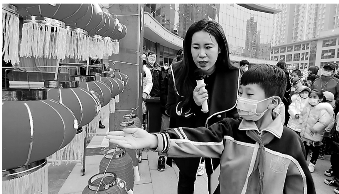
▲新华区建北街道办事处在三里家园小区举办了冬奥主题的元宵节活动，吸引了居民的眼球。

今年，吴桥杂技大世界将继续把智慧景区建设作为重点，继续提高景区的智慧管理和智慧服务水平，为游客提供更舒适便捷的游览体验。