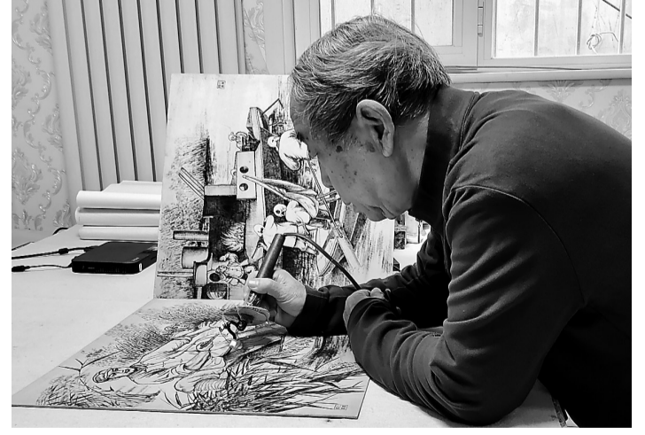
烙铁为笔,烙痕为墨。