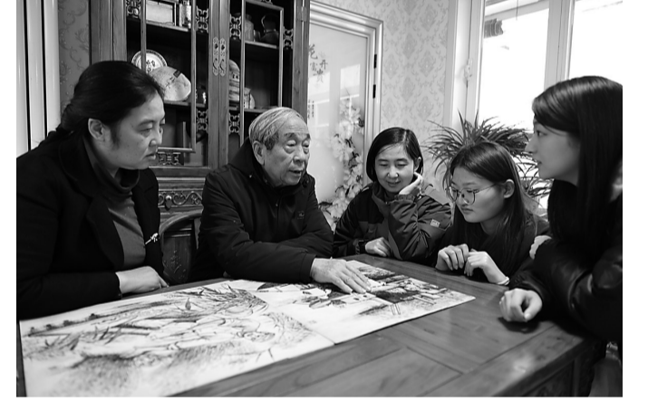
和大家讲解烙画里的故事

《小兵张嘎》《芦荡枪声》《神出鬼没》《暗夜偷袭》《智夺敌船》5幅边长45厘米的作品内容各异,作品中的芦苇、水波等细微之处颇见功底,人物形象呼之欲出。画面生动展现