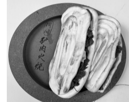
用粘土控制的驴肉火烧