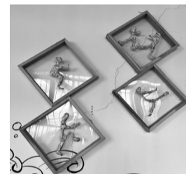
锡纸小人展现传统武术