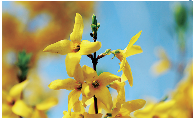
连翘 木犀科 花期：三月下旬到四月上旬 观赏地点：迎宾大道景观带、永济路、解放西路、黄河路等