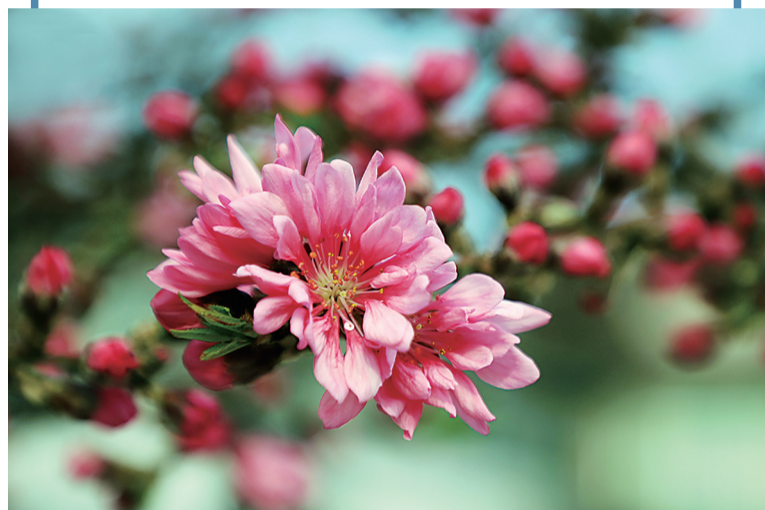
菊花桃 蔷薇科 花期：三月到四月 观赏地点：解放西路、运河景观带

在迎宾大道上，放眼望去，姹紫嫣红，香气袭人。最吸引人的莫属西府海棠，它花开似锦，有“花中神仙”“花贵妃”“花尊贵”的美称。又似亭亭少女，花朵红粉相间，叶子嫩绿可爱，娇艳动人。