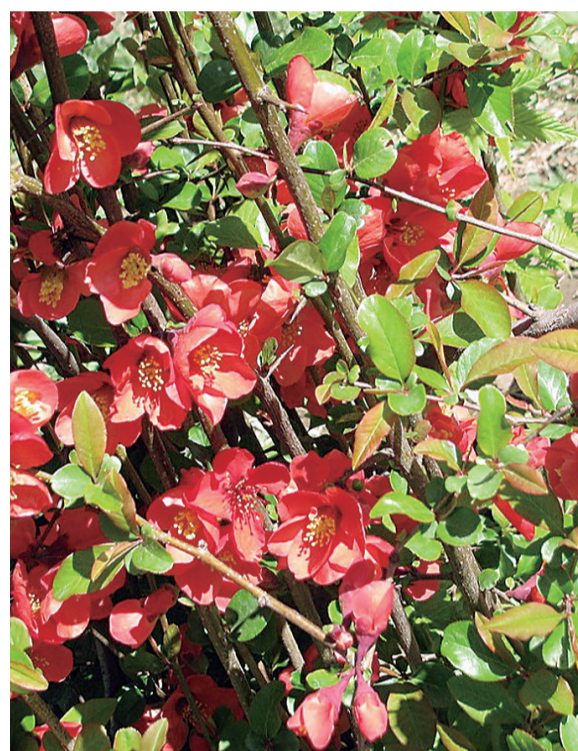
贴梗海棠 蔷薇科 花期：三月到五月 观赏地点：解放西路、御河西路

春季发芽、秋季红果满枝头的金银木；花团锦簇的紫荆；繁花簇拥、艳丽 烈的碧桃，还有木槿、杏花……都在装扮着迎宾大道。