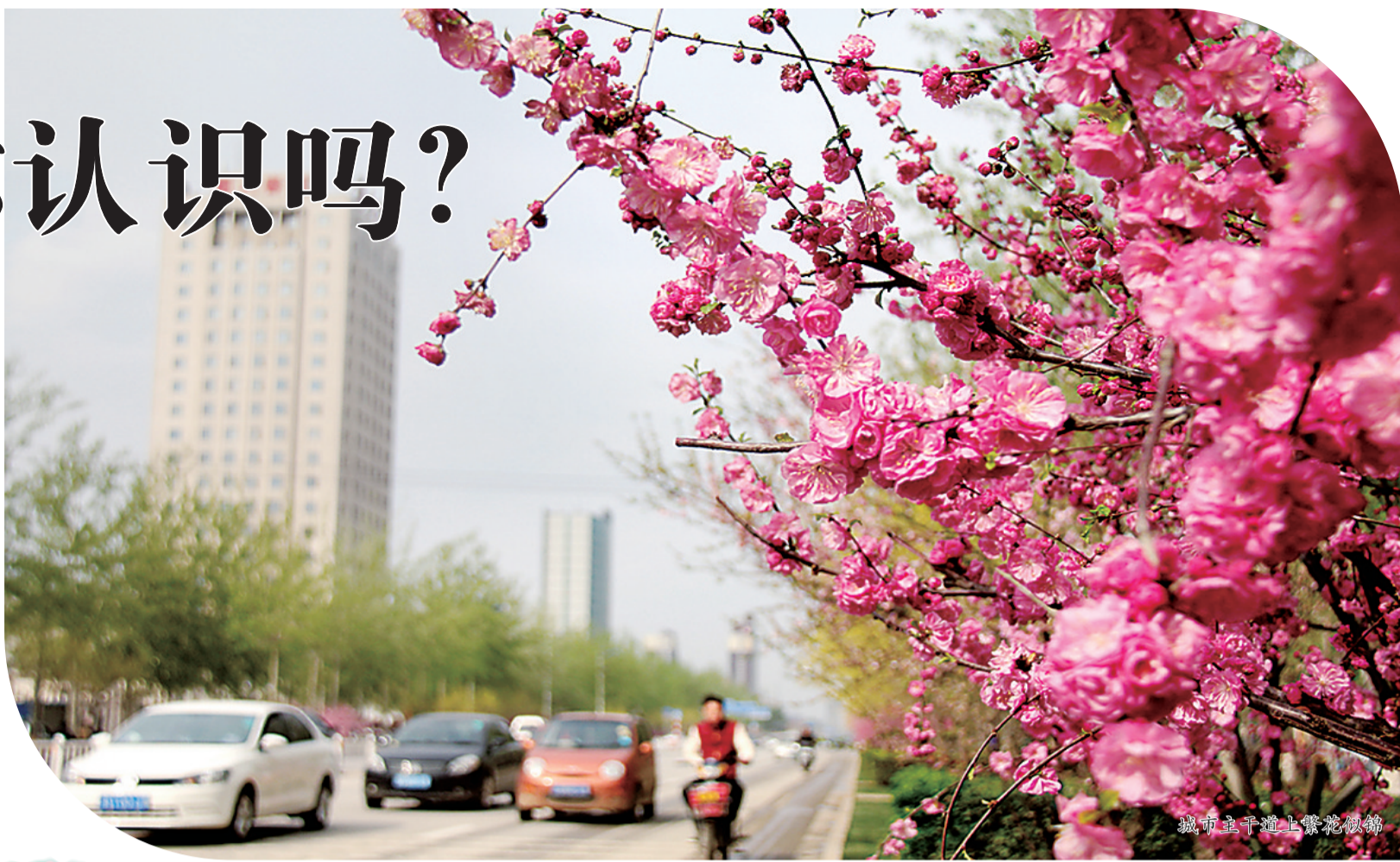
城市主干道上繁花似锦

生怕错过了大美春光的市民们，纷纷踏上了寻花、赏花、拍花之旅。点点迎春花迎风曼舞，一树树的榆叶梅灿烂多姿，粉红的桃花、雪白的梨花、娇艳的西府海棠……让人流连忘返。还有很多叫不上名字的花朵，勾起了市民们的好奇心，争相拍摄、探寻每一朵花的足迹。