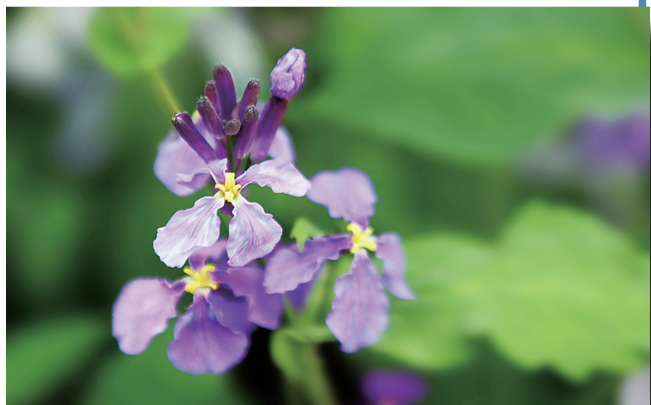
二月兰 十字花科 花期：三月下旬到四月下旬 观赏地点：迎宾大道