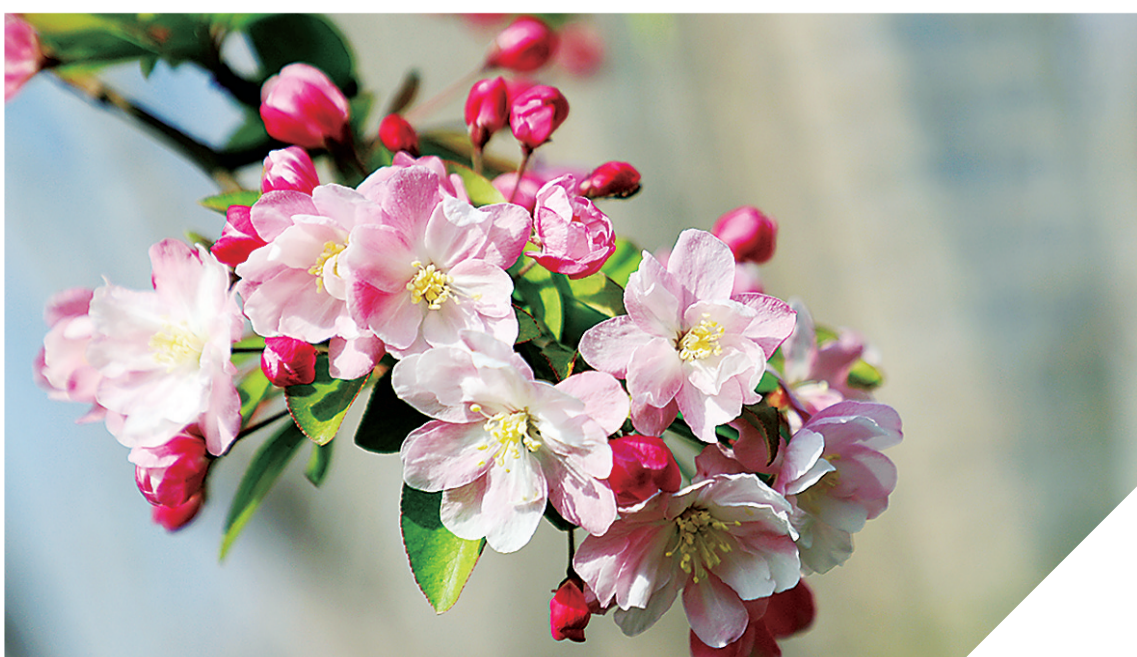
梨花 蔷薇科 花期：三月下旬到四月上旬 观赏地点：浮阳大道、迎宾大道、御河西路、解放西路、西府海棠 蔷薇科

市区的主干路上，到处繁花盛开，踏青赏花正当时。随着气温的升高，道路绿地内的紫薇、月季、四季玫瑰、木槿等花卉也将陆续开放。