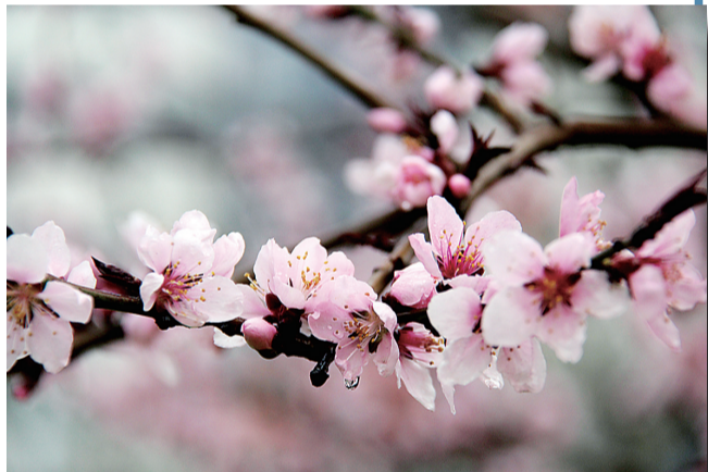
紫叶李 蔷薇科 花期：三月到四月 观赏地点：清池大道、迎宾大道、解放西路、黄河路等