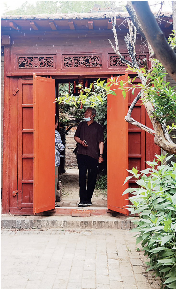
百年老宅历经风雨