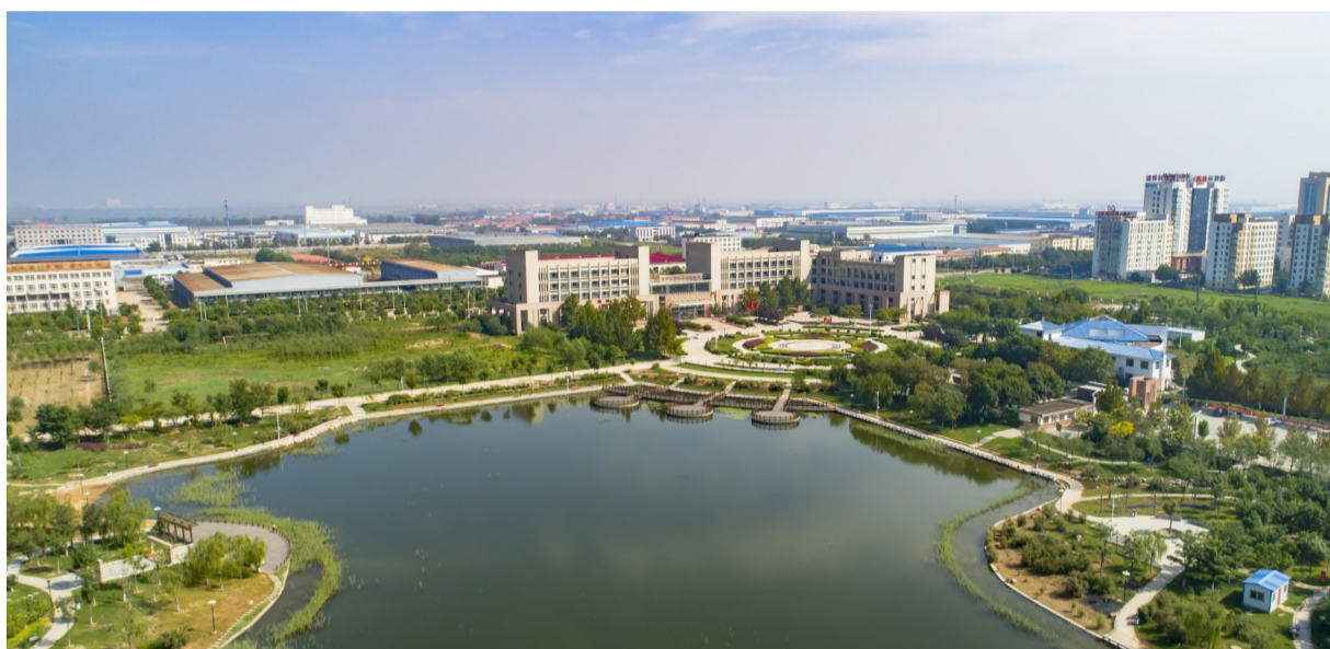
随着开发区提档升级不断推进，各开发区软硬环境不断优化。图为沧州经济开发区鸟瞰。

经济要发展，项目是关键。项目是加快发展的主抓手，是改善民生的支撑点；重大项目更是经济社会