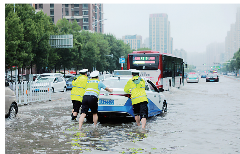
为确保雨天道路通行安全，市交警支队全警提前上岗、加强指挥疏导，提醒过往驾驶员雨天减速慢行，保持安全车距。仅8月22日早高峰，执勤交警就帮助解决各类求助58起。