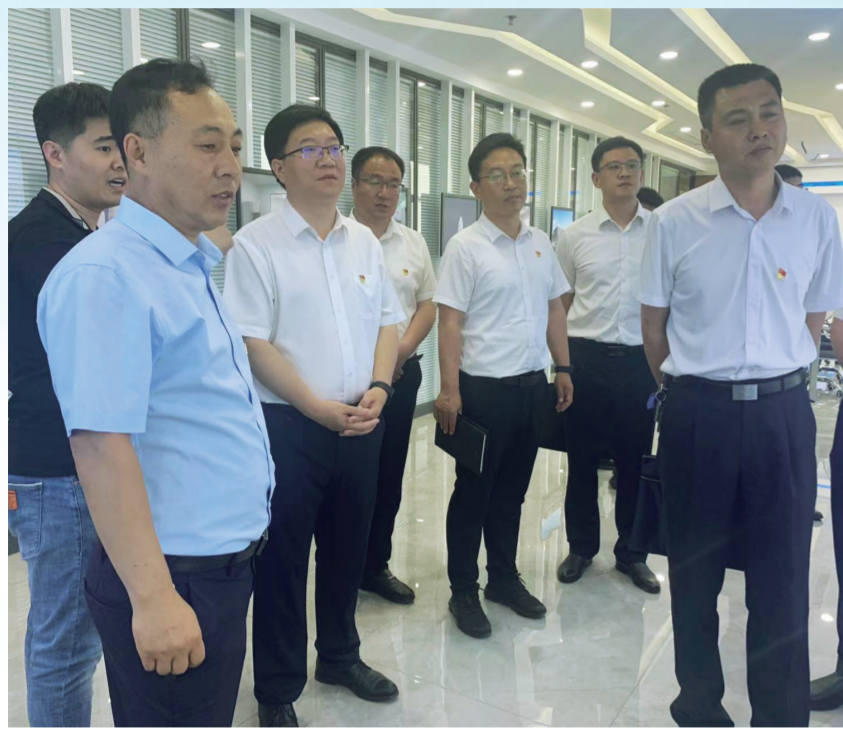
上级领导来杜生镇调研企业发展情况