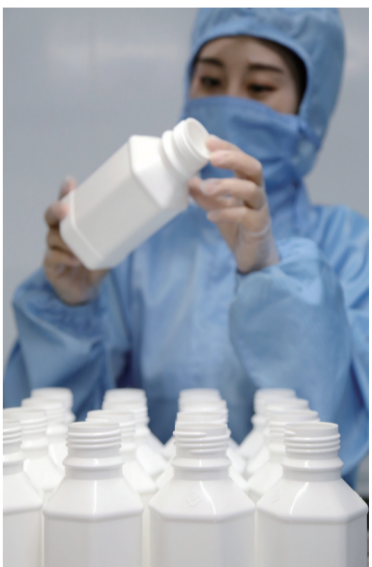
工人正在检验药包材产品

除了园区这一自身发展载体,杜生镇还瞄准更高的平台。从2019年开始,以杜生镇为主体的沧县连续举办了三届中空塑料制品展会,吸引了全国各地大量客户关注,达成大量合作意向。杜生镇以展会为契机,打造区域品牌,深化交流合作,加快推动药包材企业转型升级。据了解,第四届展会初定