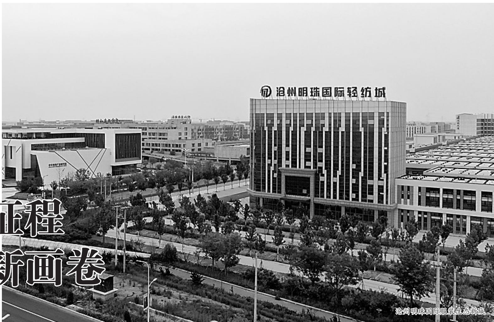
沧州明珠国际服装生态新城