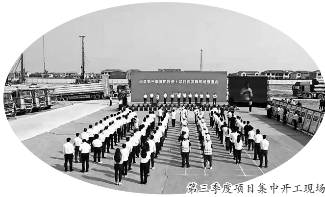
第三季度项目集中开工现场

同时，为迅速贯彻落实国家市场监督管理总局等14个部门举办的首届“全国个体工商户服务月”启动仪式会议精神和《关于开展“全国个体工商户服务月”活动的通知》要求，沧县市场监管局召开首届“沧县个体工商户服务月”启动协调会，正式启动沧县首届“个体工商户服务月”活动，以“送服务、办实事、促发展”为主题，聚焦个体工商户发展面临的困难和诉求，充分调动社会各方面力量，扎实推动各项纾困政策落地落实，积极引导全社会关心关爱个体工商户，共同促进个体工商户健康发展。