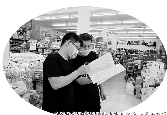
乡镇干部进商超讲解省市县经济一揽子政策