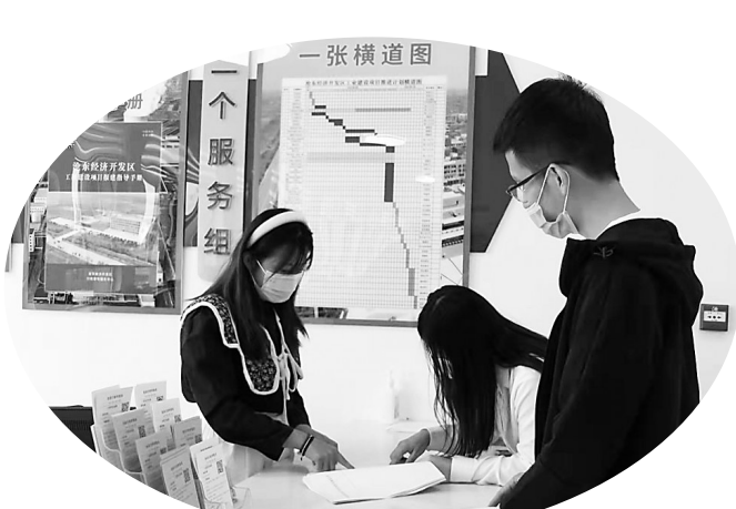
优化行政审批流程助企服务