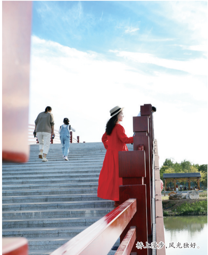
桥上漫步，风光独好。

今年，公园又对100多座石狮进行了重新安置和集中摆放。按照狮子与史、狮子与运河、狮子与仕、狮子与石、狮子与市的主题进行分类，市民根据这个路线，可以认识狮子的演化历史，了解铁狮子望运河的渊源。