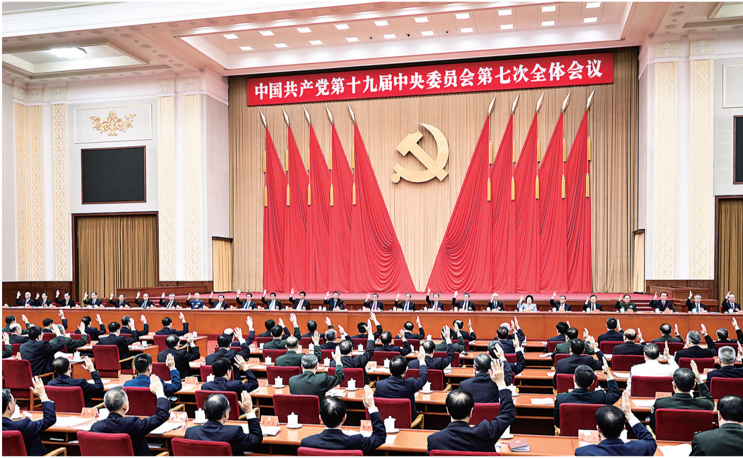
中国共产党第十九届中央委员会第七次全体会议，于2022年10月9日至12日在北京举行。中央委员会总书记习近平作重要讲话。