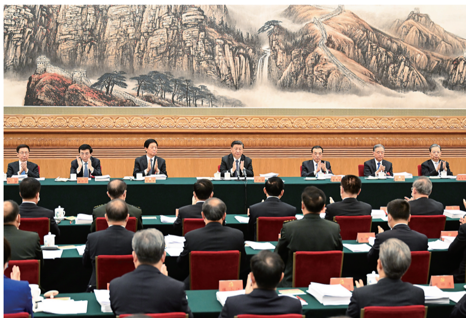
10月18日，中国共产党第二十次全国代表大会主席团在北京人民大会堂举行第二次会议。习近平、李克强、栗战书、汪洋、王沪宁、赵乐际、韩正等出席。