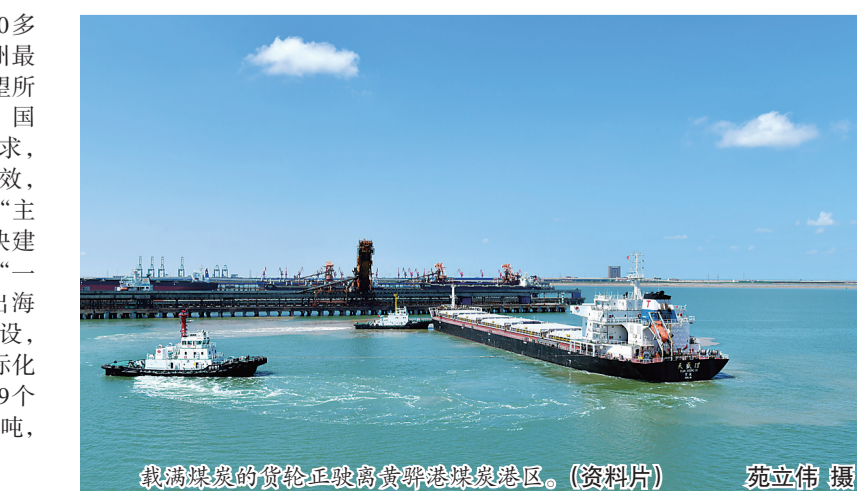
载满煤炭的货轮正驶离黄骅港煤炭港区。(资料片) 苑立伟 摄

城市之一，拥有116公里海岸线，有270多平方公里的未利用地，沿海临港是沧州最大的优势，也是发展的潜力所在、希望所在。近年来，为深入贯彻落实党中央、国务院决策部署和省委、省政府工作要求，努力在沿海经济发展方面取得更大成效，我市坚持把港口作为沿海经济发展的“主引擎”，全力推动港口转型升级，加快建设现代化综合服务港、国际贸易港、“一带一路”重要枢纽和雄安新区便捷出海口，不遗余力推动黄骅港基础设施建设，完善港口功能和集疏运体系，港口国际化水平和对外辐射能力不断提升。今年前9个月，黄骅港累计完成货物吞吐量2.29亿吨，集装箱累计完成71.23万标箱。 (下转第四版)