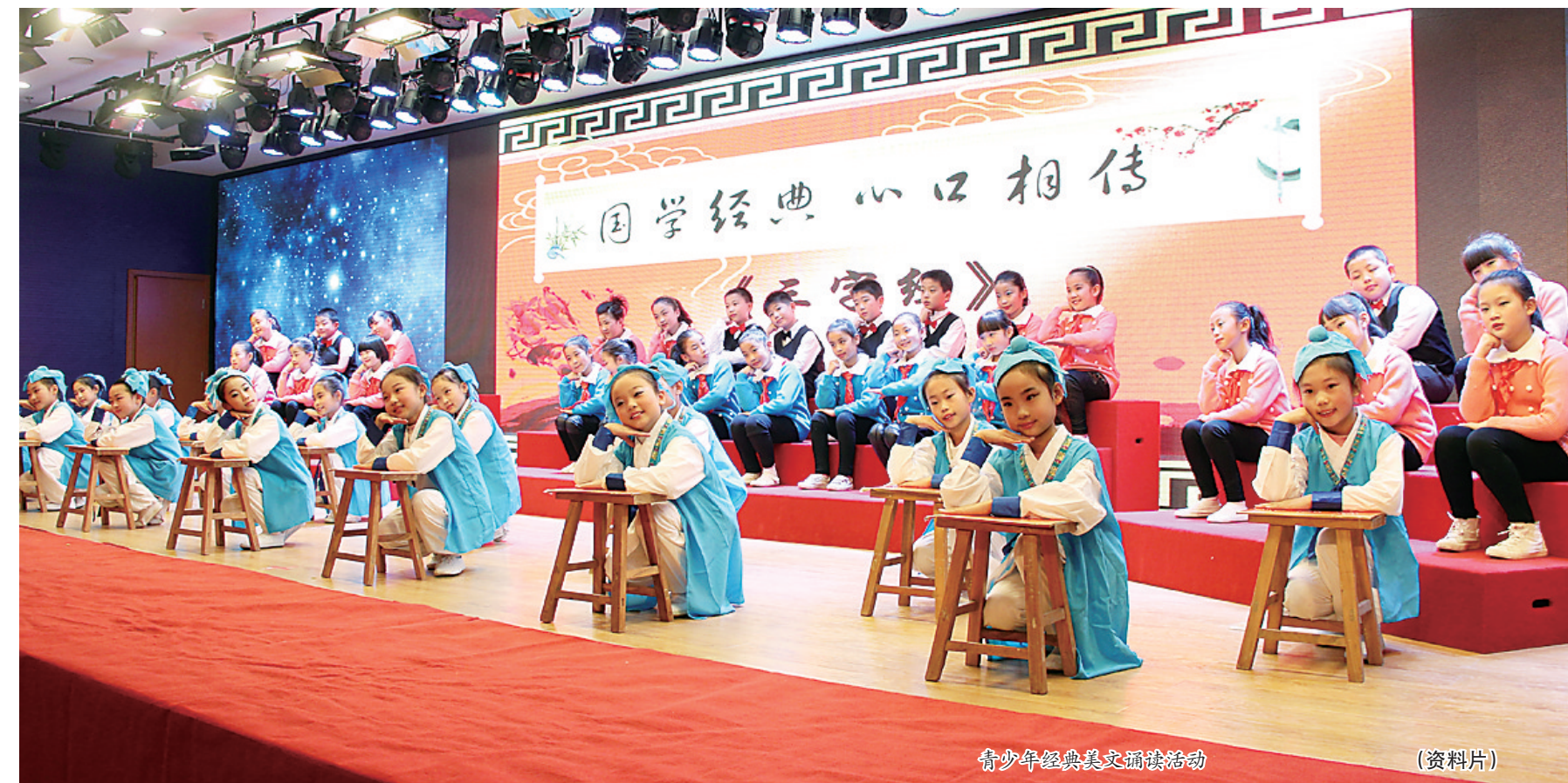
青少年经典美文诵读活动