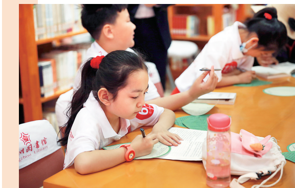
认真的小读者(资料片)