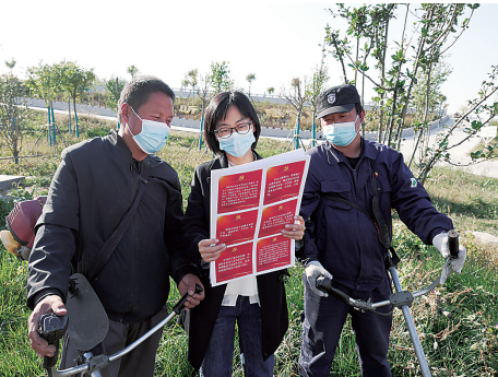
在北赵家坟村宣传党的二十大精神