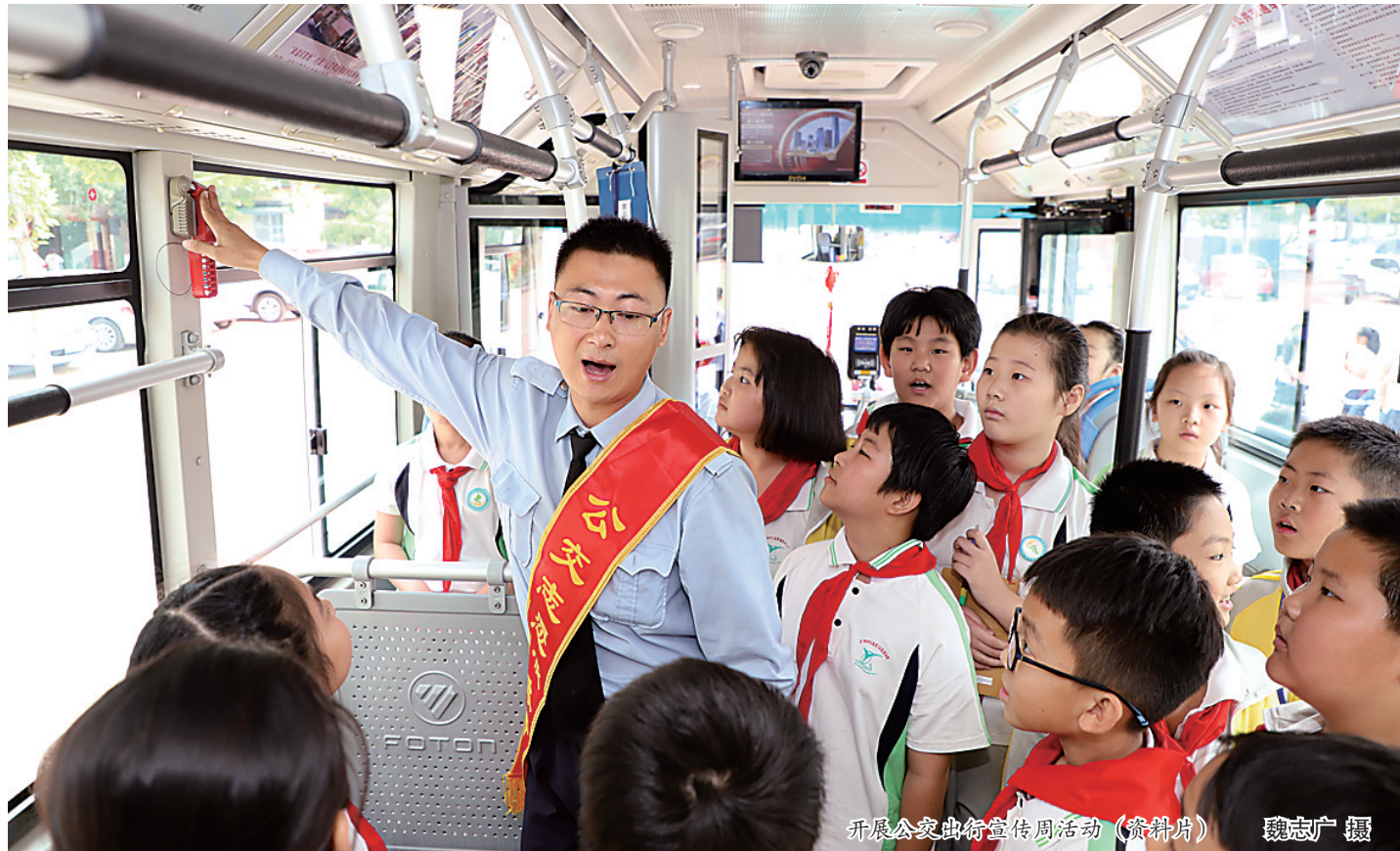
开展公交出行宣传周活动(资料片)

沧州公共交通集团有限公司秉承“服务城市建设、服务经济发展、服务人民群众”的行业宗旨,牢固树立“公交是窗口、人人是名片、处处是精品”的高标准服务理念,始终把深化全国文明城市创建作为全面提升企业高质量发展的重要抓手,发挥文明窗口的示范引领作用,全力打造市民满意公交。