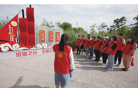
长芦公园内宣传社会主义核心价值观