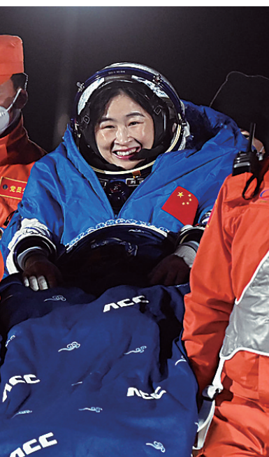
12月4日，神舟十四号载人飞船返回舱在东风着陆场成功着陆。这是航天员陈冬（中）、刘洋（右）、蔡旭哲安全顺利出舱。

纬度坐标。整张立体搜救网迅速收拢，5架搜救直升机盘旋下降，车辆向预报落点疾驰而去，留下一片尘烟。