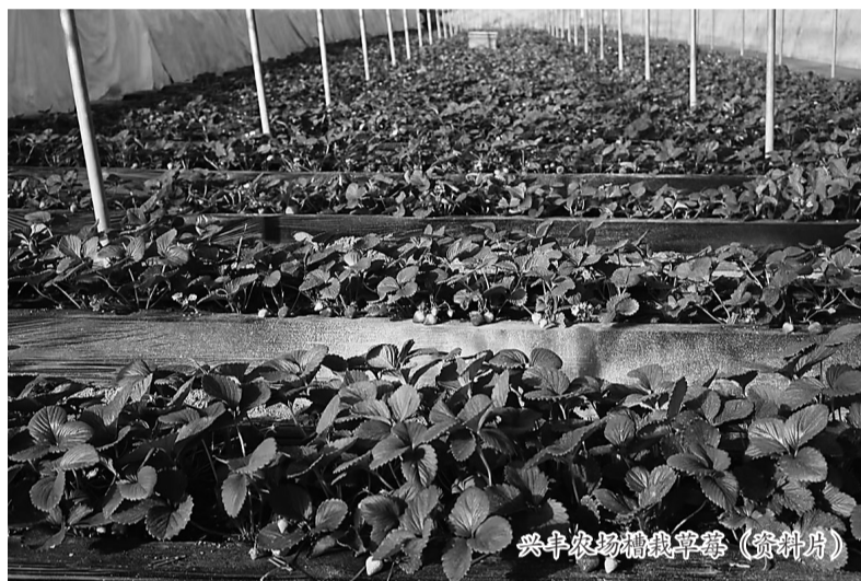
兴丰农场种植草莓（资料片）

原来，这里不仅是辛中驿镇着重打造的特色种植基地，还是辛中驿镇东王团村、西王团村、前台基