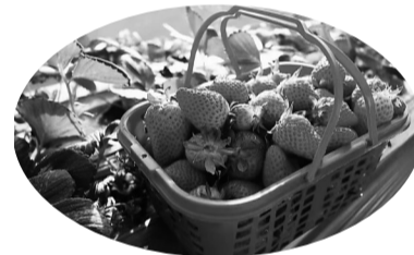
绿色草莓“颜值”高（资料片）

原来，这里不仅是辛中驿镇着重打造的特色种植基地，还是辛中驿镇东王团村、西王团村、前台基