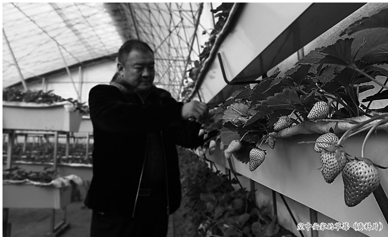
室中安家的草莓（资料片）

眼下，我市各地温室中，又开始弥漫着清甜的莓香。簇簇绿叶间，一个个草莓露出鲜红的笑脸，甚是诱人。近年来，随着设施农业发展，我市不少经营主体将致富的目光瞄向了草莓种植。特色定植、生态管理、创新运营……在他们的不懈探索下，一个个小草莓，不仅甜了农户的日子，还鼓起了村集体的钱袋子——