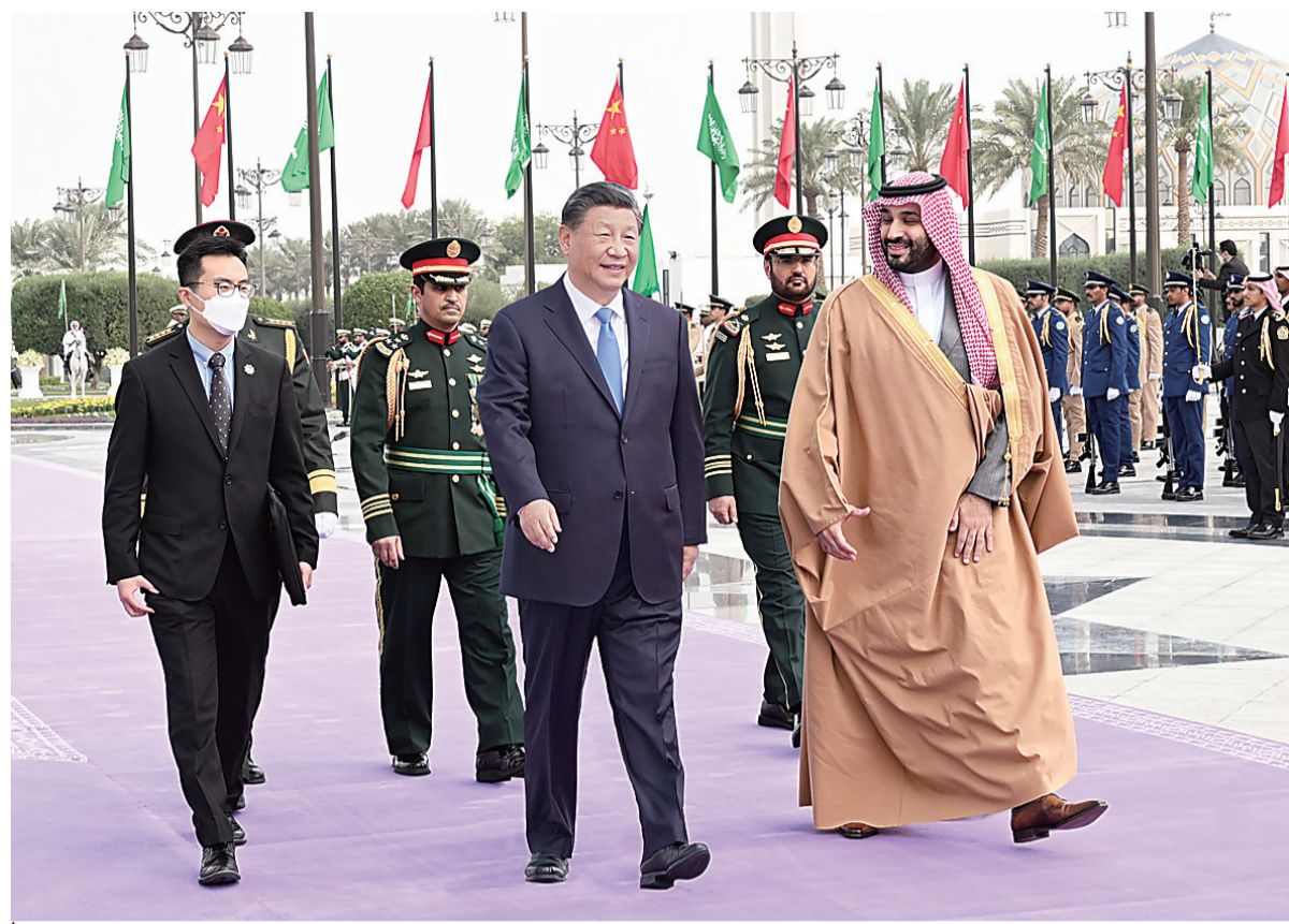
当地时间12月8日中午，沙特王储兼首相穆罕默德代表国王萨勒曼为正在沙特进行国事访问的国家主席习近平在利雅得王宫举行欢迎仪式。