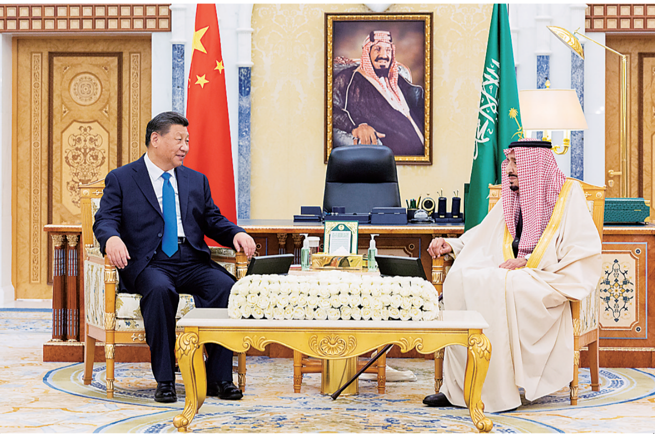
当地时间12月8日下午，国家主席习近平在利雅得王宫会见沙特国王萨勒曼。