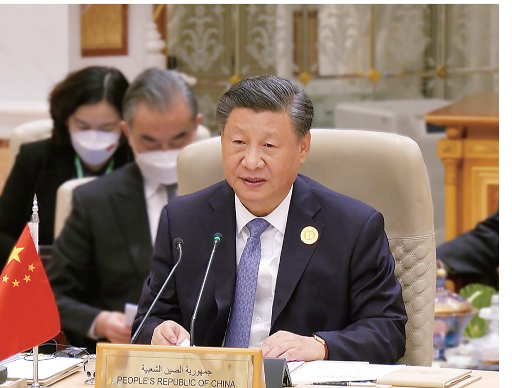
当地时间12月9日下午，国家主席习近平出席首届中国—海湾阿拉伯国家合作委员会峰会并发表题为《继往开来，携手奋进 共同开创中海关系美好未来》的主旨讲话。