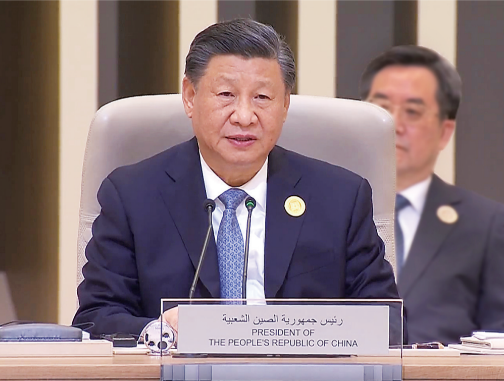
当地时间12月9日下午，国家主席习近平出席首届中国—阿拉伯国家峰会并发表题为《弘扬中阿友好精神 携手构建面向新时代的中阿命运共同体》的主旨讲话。

强调弘扬守望相助、平等互利、包容互鉴的中阿友好精神，携手构建面向新时代的中阿命运共同体