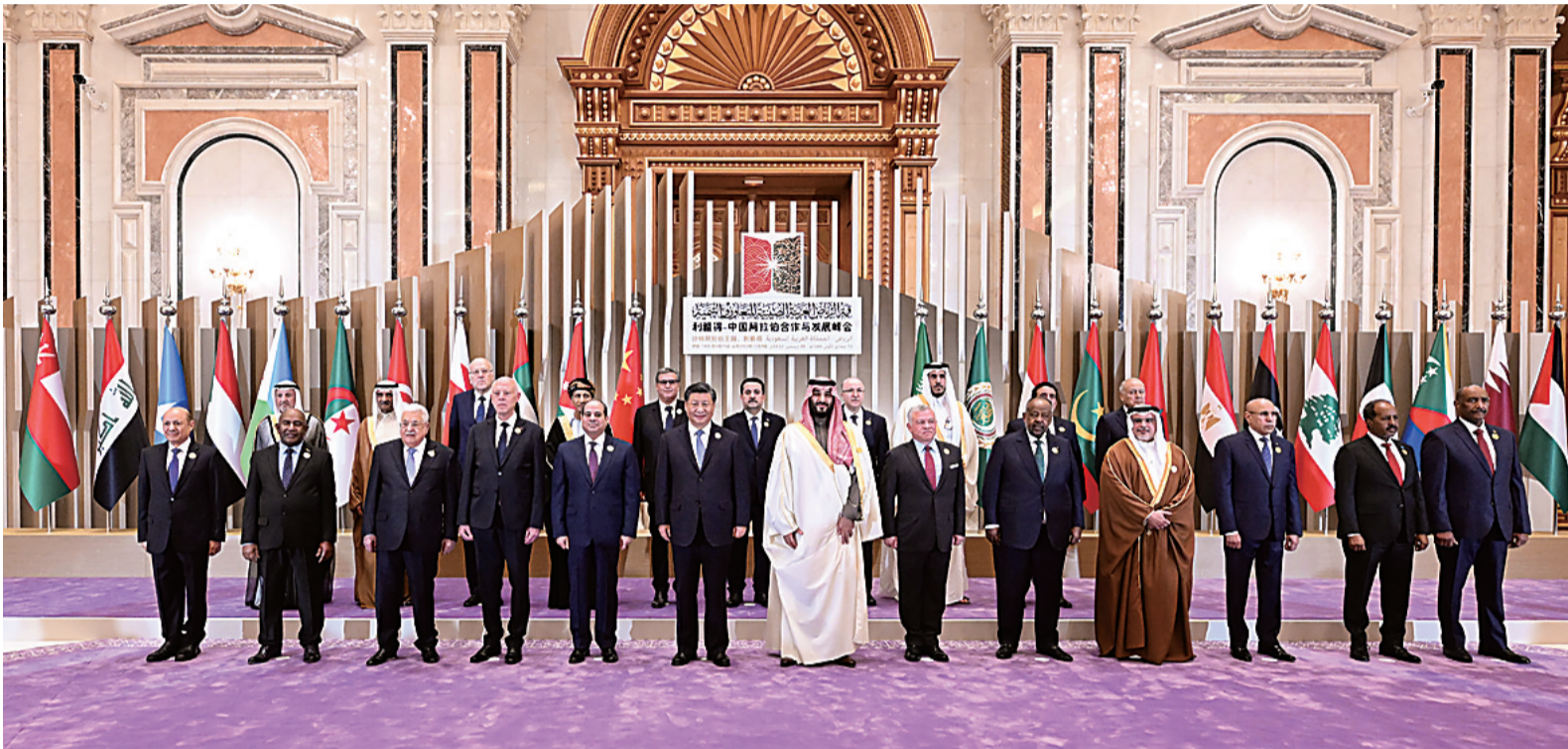
当地时间12月9日下午，国家主席习近平和21个阿盟国家领导人以及阿拉伯国家联盟秘书长盖特等国际组织负责人出席首届中国—阿拉伯国家峰会。

新华社利雅得12月9日电 当地时间12月9日下午，首届中国—阿拉伯国家峰会在沙特首都利雅得阿卜杜勒阿齐兹国王国际会议中心举行。峰会发表《首届中阿峰会利雅得宣言》，宣布中阿双方一致同意全力构建面向新时代的中阿命运共同体。 国家主席习近平和沙特王储兼首相穆罕默德、埃及总统塞西、约旦国王阿卜杜拉二世、巴林国王哈马德、科威特王储米沙勒、突尼斯