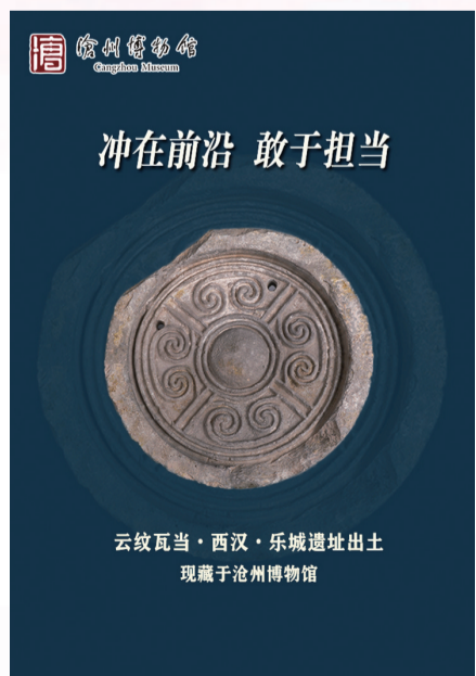
云纹瓦当·西汉·乐城遗址出土 现藏于沧州博物馆