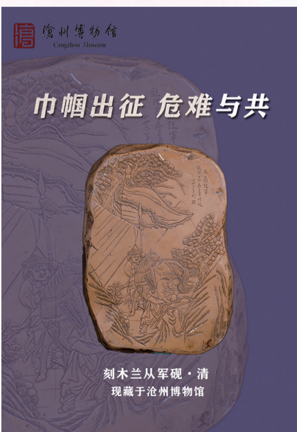
刻木兰从军砚·清 现藏于沧州博物馆