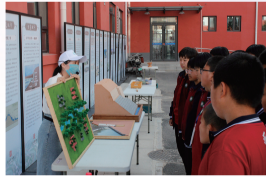
运河文化巡展走进盐山七中

引领作用,积极与文化企业对接,开展跨界合作,建立互利双赢的合作模式,努力创作更多优秀文创作品,进一步活化历史文化,拉近馆藏文物与观众间的距离,为人民群众体验美好生活提供更多优质产品和更好的应用场景。