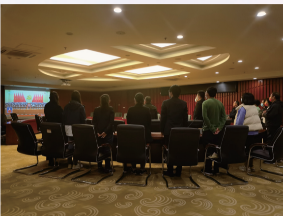
沧州博物馆全体党员干部集中观看党的二十大开幕式