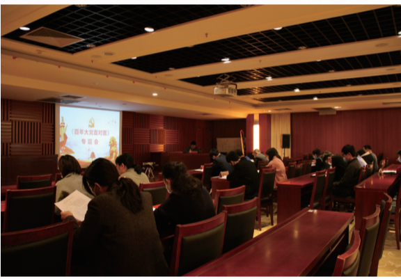
沧州博物馆每周五下午组织开展集中理论学习