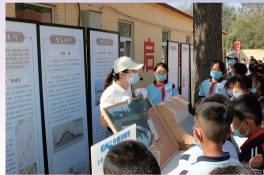
运河文化巡展走进沧县仁和村小学

学资源,满足学生对知识的渴求,让学生在校园就有机会接触历史文化,增强学生对文物的保护和对中国文化的传承意识。随着活动的深入开展,沧州博物馆工作人员先后走进沧州市新世纪小学、解放路小学、沧县仁和村小学以及盐山多所学校,推动博物馆教育资源与学校教育需求的有机衔接,让校园博物馆成为师生的全新课堂,活动惠及师生千余人。