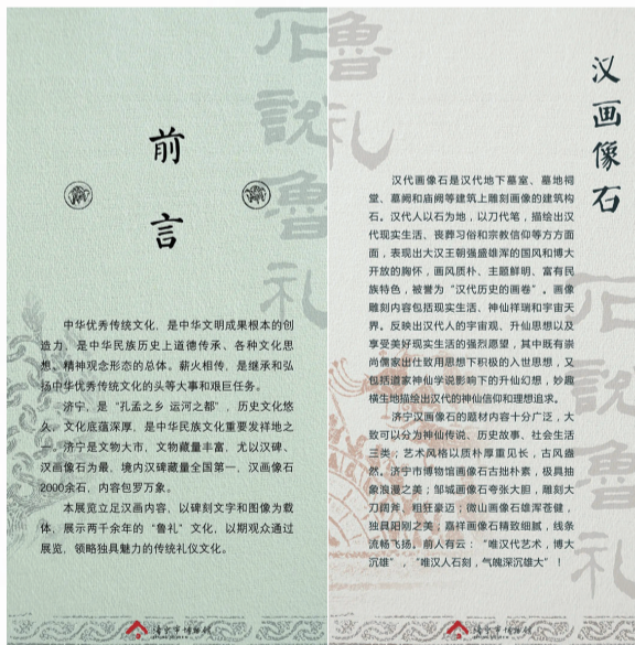
《汉画像石上的孔子与鲁礼文化拓片展》