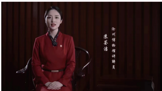
沧州博物馆讲解员参加第二届河北省红色故事讲解员大赛并获奖

启航新时代,奋进新征程。作为沧州对外开放的一张金字招牌,沧州博物馆全体党员干部职工将继续奋力拼搏、昂首奋进,奋力书写博物馆高质量发展的壮美画卷。