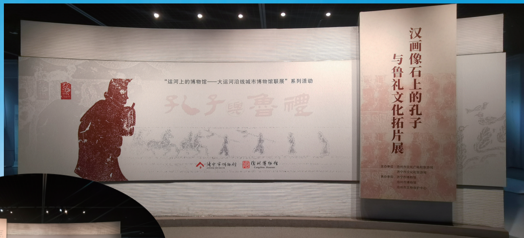
“运河上的博物馆——大运河沿线城市博物馆联展”活动

这一年,在做好疫情防控工作的基础上,沧州博物馆紧紧围绕免费开放核心工作,创新工作思路,提升服务效能,对标最高标准、最高水平,按照一流设施、一流藏品、一流服务的目标,打造高效能场馆治理、高品质展览教育、高质量艺术征集、高水平科学研究新格局,赢得市民广泛关注和一致好评。