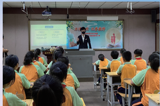
运河文化巡展走进新世纪小学

每周五下午组织开展集中理论学习,每周党支部委员会、党小组分别进行视频学习。同时,利用《学习强国》等平台开展自学,推动学习宣传贯彻党的二十大精神走深走实、入脑入心,持续兴起学习宣传贯彻热潮。