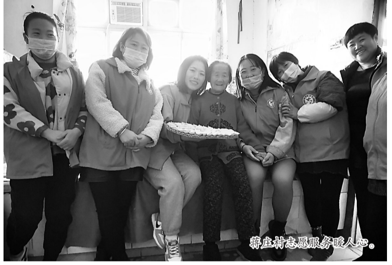
蒋庄村志愿服务暖人心