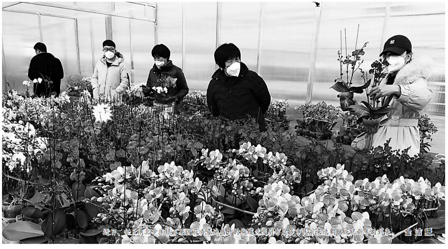
沧州市北肖庄子村生态农场举办的“绿色小农”新年农事体验活动