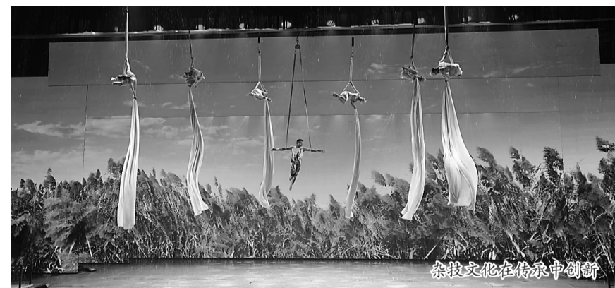
杂技文化在传承中创新

推进PM 2.5 和臭氧协同治理，常态化开展河湖“四乱”问题清理整治，强化土壤污染源头防控，确保管控措施实现全覆盖。抓生态环境修复。推进“万塘千渠百河”水系连通工程，提升防洪除涝减灾、水资源统筹调和水生态环境保护能力。巩固地下水超采综合治理成果，全年新建回灌站33座，引水6000万立方米，压采地下水127万立方米。科学开展国土空间绿化行动，全年造林800亩，创建省级森林乡村1个。抓绿色低碳发展。积极发展光伏、风电等新能源，加快推进坑塘光伏发电项目。坚决遏制“两高”项目盲目上马，确保单位GDP能耗、单位GDP二氧化碳