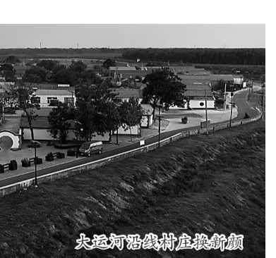
大运河沿线村庄换新颜

大运河文化带建设跃上新台阶。 改造提升运河公园、五季公园巡河驿道8.5公里，完成34.8公里堤顶路和6条“鱼刺路”精细化打磨。六大文旅实体项目扎实推进，红牡丹杂技文化研学基地、杂技山水小镇商业主体竣工，杂技博物馆地下人防工程基本完工，海洋·极地世界、杂技学校二期开工建设，环球杂技城规划完成。球幕影院开业运营，运河人家美食街实现部分