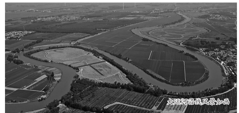
大运河沿线风景如画

个，完成3所公办养老院消防改造，8个社区实现日间照料点全覆盖，率先在全市完成特困老人家居适老化改造。教育水平显著提高，景澜幼儿园开园招生，实验小学等9所学校改造完成，职教中心宿舍楼等7个项目扎实推进，全县中小学实现联网互通。文化事业繁荣发展，发放大世界门票2万张、文化惠民券15071张、文化惠民卡600张。新建城市书房1个，打造农村文艺团队15支，开展线上文化活动126期、线下演出28场。医疗服务水平显著提升，县中西医结合医院传染病区楼建成投用，县医院影像楼竣工验收，17个社区卫生站建设完成。疫情防控有力有效，严格落实优化疫情防控各项举措，在常规防护阶段实现动态清零。平安吴桥持续深化，坚持不懈抓好安全生产、食品药品安全、金融风险管控和隐患排查化解，社会大局和谐稳定。国防动员和“双拥”共建深入推进。