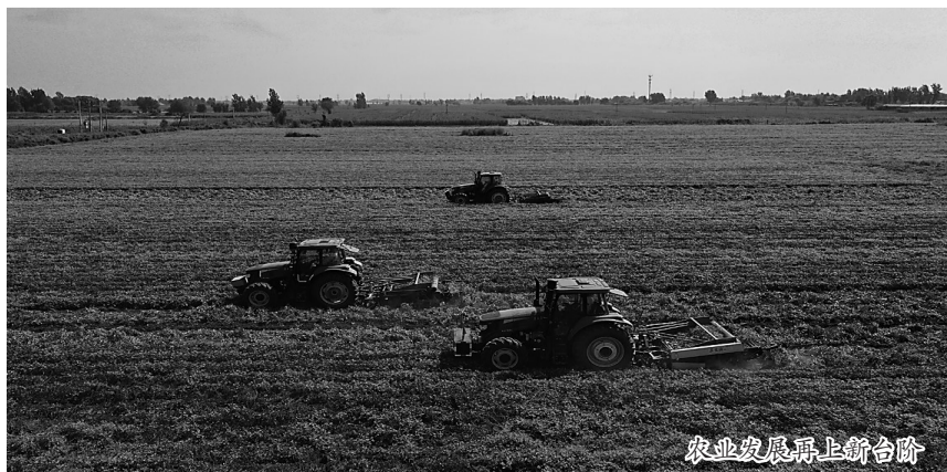
农业发展再上新台阶

排放量和社会消费品零售总额等指标完成市定任务目标。 坚持以人为本、人民至上，着力书写人民美好生活新篇章。 提升社会保障水平。确保城镇零就业家庭动态清零，扎实做好保交楼、保民生、保稳定各项工作，持续开展房地产市场秩序规范整治，筹建保障性租赁住房100套。办好人民满意教育。加快吴桥中学、职教中心宿舍楼和实验小学操场建设，实施第二初中等5所学校运动场改造工程，创建省级示范幼儿园3所。推进职普融通、产教融合，优化职教中心专业设置，主动适应经济社会发展需要。全面落实“双减”政策，培养高素质教师队伍，弘扬尊师重教社会风尚。加快打造健康吴桥。认真落实新阶段疫情防控各项举措，做好群众就医用药保障，全力保障人民生命安全和身体健康。持续深化医药卫生体制改革，加快医共体建