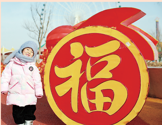
蒸面花、吹糖人、选福字，年味浓浓的民俗文化大集上，人们用不同的方式，寄托对兔年的美好愿望。