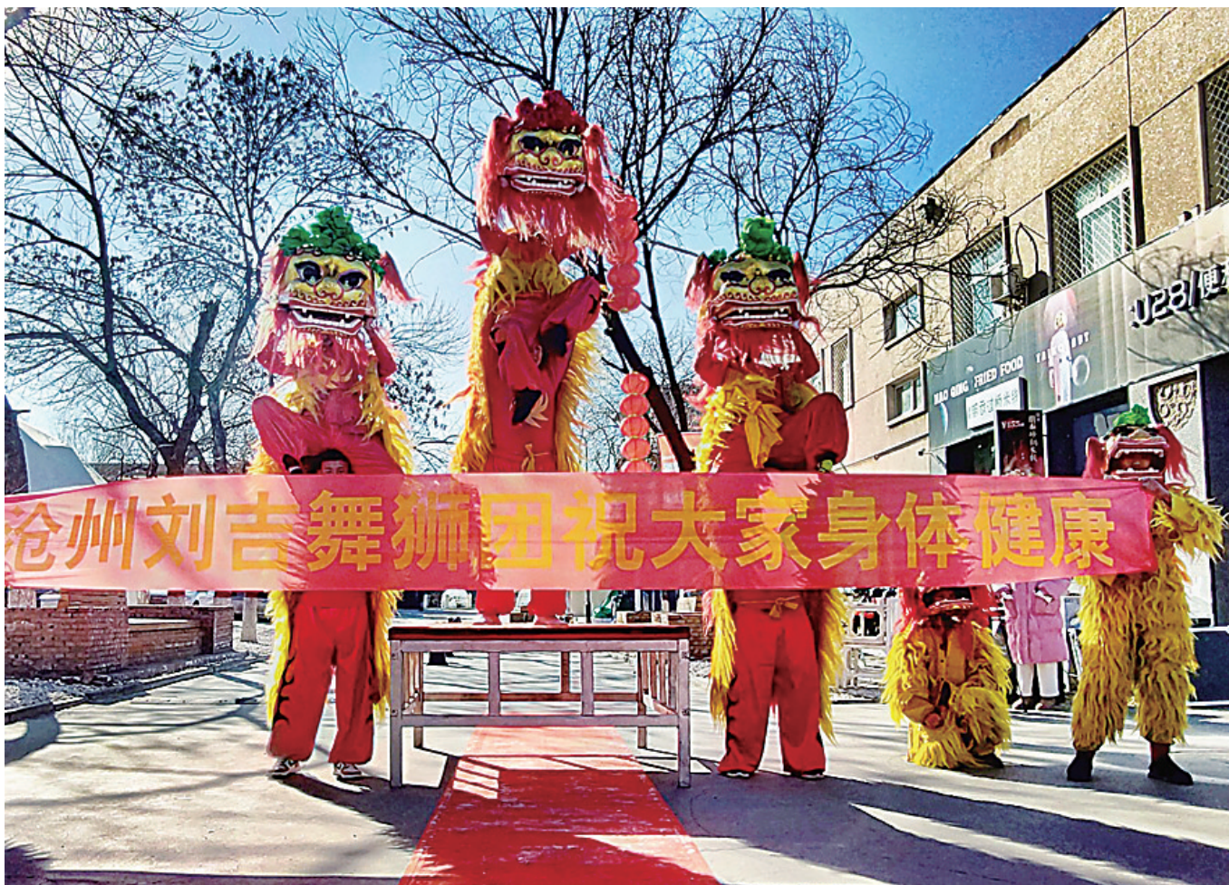
沧州狮子舞出兔年新气象

2023年的兔年注定是非同寻常的一年。 今年，许多相隔已久的人终于能回乡团聚，在热气腾腾欢声笑语中，品味这来之不易的暖暖亲情；今年，人们感叹，曾一度越来越淡的春节，在人潮涌动的大集上，在琳琅满目的非遗文创作品里，散发出浓浓的传统文化味；今年，人们终于能自由地徜徉于街市、游走在乡间，体味吉祥活泼的生肖兔带来的新年新开局。 一年之计在于春。 在兔年春节里，几乎每个人都根据兔年的新局面，思量着自己的新计划。劳动者去更挣钱，建设者们考虑着那些拉动经济的项目新预案，经营者们衡量着哪些会是兔年的畅销商品。而非遗艺术家们，不仅为传统的节日奉献上艺术性的精雕细刻，烘托出深具传统文化意味的民俗“年味儿”，更把所有人兔年里追求幸福圆满的心气儿凝缩成一往直前的红红火火。 赶大集、赏非遗、创佳绩，兔年的新开局在摄影师的镜头里，在非遗艺术家的作品里，在大集上人头攒动里，在冒着热气的吆喝里。当人们凝眸色彩缤纷的年俗文化时，动人一瞥处，便是一片兔年的“新视界”。