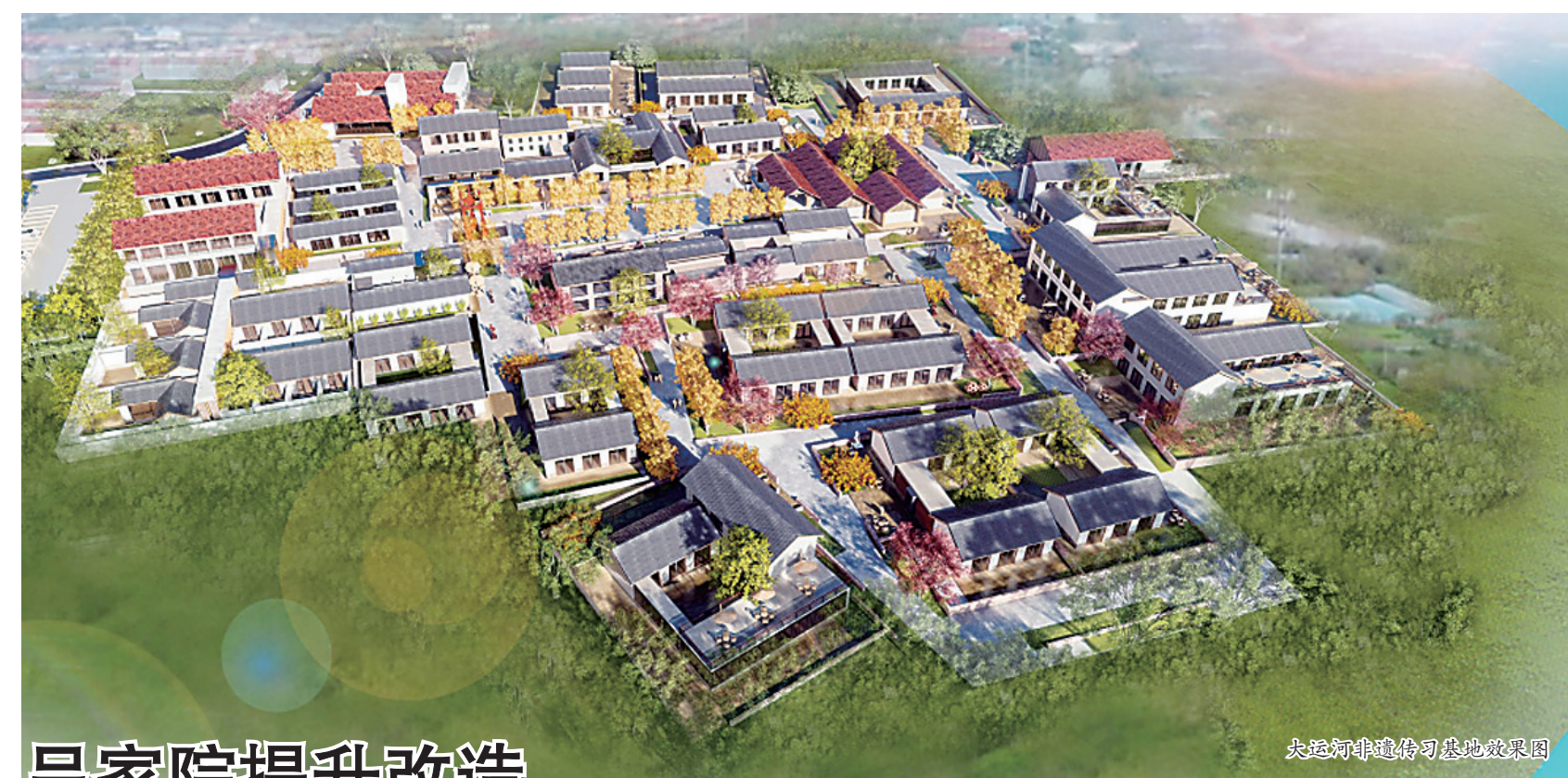
大运河非遗传习基地效果图