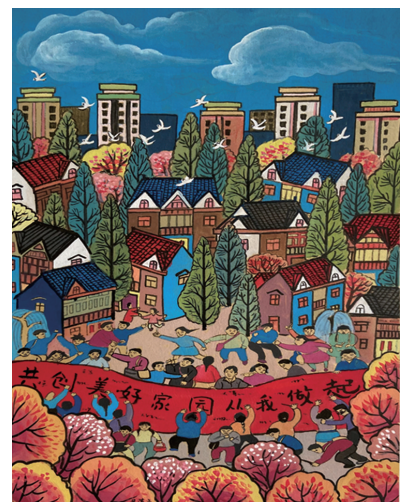
《共创美好家园从我做起》 (美术 尹萍)