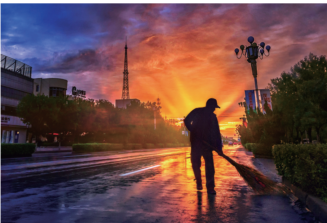
《城市之光》(摄影 沈新生)

筐,扛着锨干得热火朝天,放了学的孩子们都跑过去帮忙。这片沉寂的只有蚊蝇鼠类横行的死地慢慢又“活”了过来。湖边的垃圾好清理,湖水却不是那么容易变清澈的。村里邀请了专家研究考察,最终决定采用“日常管理+清淤”的方法,治理湖面。湖的面积小,一次性清理到位虽然费时费力,但是之后只要日常维护好就能长久保持下去。为此,我们村专门设置了垃圾和污水清运车,每天一早一晚围着村绕两次,大家在家门口就可以倒垃圾,就没有人愿意拎着垃圾走一段路到湖边了,从而免除了生活垃圾和污水再次入湖造成污染的风险。在全村人的齐心协力下,历时两年,终于让“西湖”恢复了它的本来面目。我觉得,今天的西湖比从前更美了。微波粼