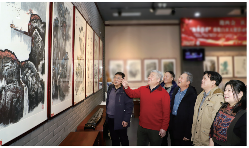
日前，“翰墨韵香”津沧书画名家作品展在雨来轩书画院举行。作品展共展出津沧书画名家画作60余幅，彰显了津沧地区深厚的文化底蕴，为全市人民献上了一场书画艺术盛宴。展览将持续至3月3日。魏志广 殷实 摄

开局之年、关键之年，新起点、新征程、新目标、新任务……一系列鼓舞人心的关键词汇聚成事业发展的主旋律。如何在汹涌澎湃的时代大潮中抢抓机遇、乘势而上？如何在你追我赶的激烈竞争中积极应变、突破跃升？(下转第二版)