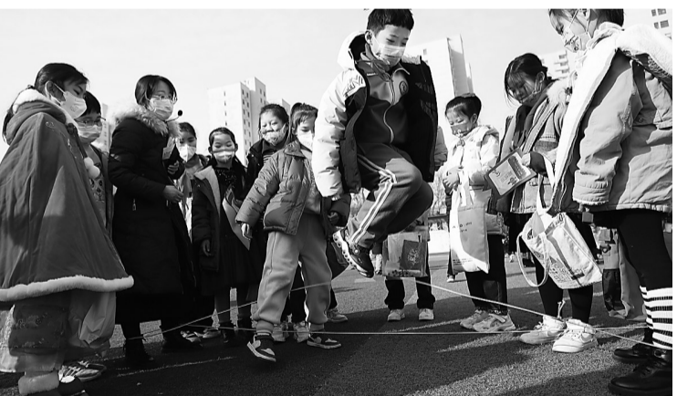
跳皮筋、翻花绳……近日,新华区中宇小学举办了以“传承民间游戏、点亮幸福童年”为主题的活动,让学生体验游戏带来的乐趣。