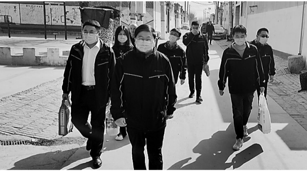
3月4日,中铁四局三公司肃宁党支部联合肃宁县西青口村党支部开展“党建引领聚合力,同心慰问学雷锋”主题活动。他们走访慰问了西青口村因病致贫的老人,送去了米面油等生活用品。