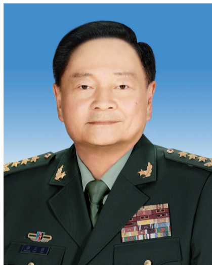
中华人民共和国中央军事委员会副主席 张又侠