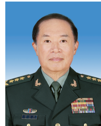
中华人民共和国中央军事委员会副主席 何卫东

张又侠，男，汉族，1950年7月生，陕西渭南人，1968年12月入伍，1969年5月加入中国共产党，军事学院基本系毕业，大专学历。