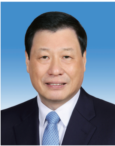
最高人民检察院检察长 应勇

现任中共二十届中央委员，最高人民法院院长、党组书记、审判员委员会委员，首席大法官。