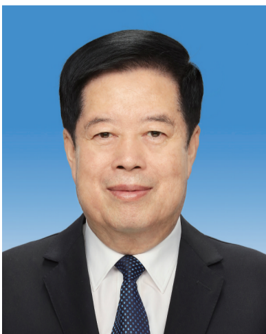
国家监察委员会主任 刘金国

刘金国，男，汉族，1955年4月生，河北昌黎人，1976年12月参加工作，1975年9月加入中国共产党，中央党校大学学历。