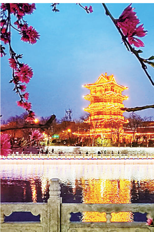
草树知春不久归，百般红紫斗芳菲。春日运河畔，清风楼下，白天花红柳绿，夜晚灯火璀璨，成为市民打卡游玩的好去处。

有了水，运河就有了生命力。未来，大运河在防洪排涝、输水供水、生态景观等方面的价值将更加凸显，带给我们的惊喜也会越来越多。作为生活在运河两岸的人，我们要做的，就是更加热爱这条母亲河，尽己所能为运河建设和发展贡献一份力量。