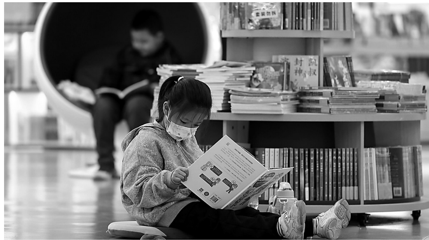
4月22日，小朋友在河北省石家庄市一家书店内阅读绘本。