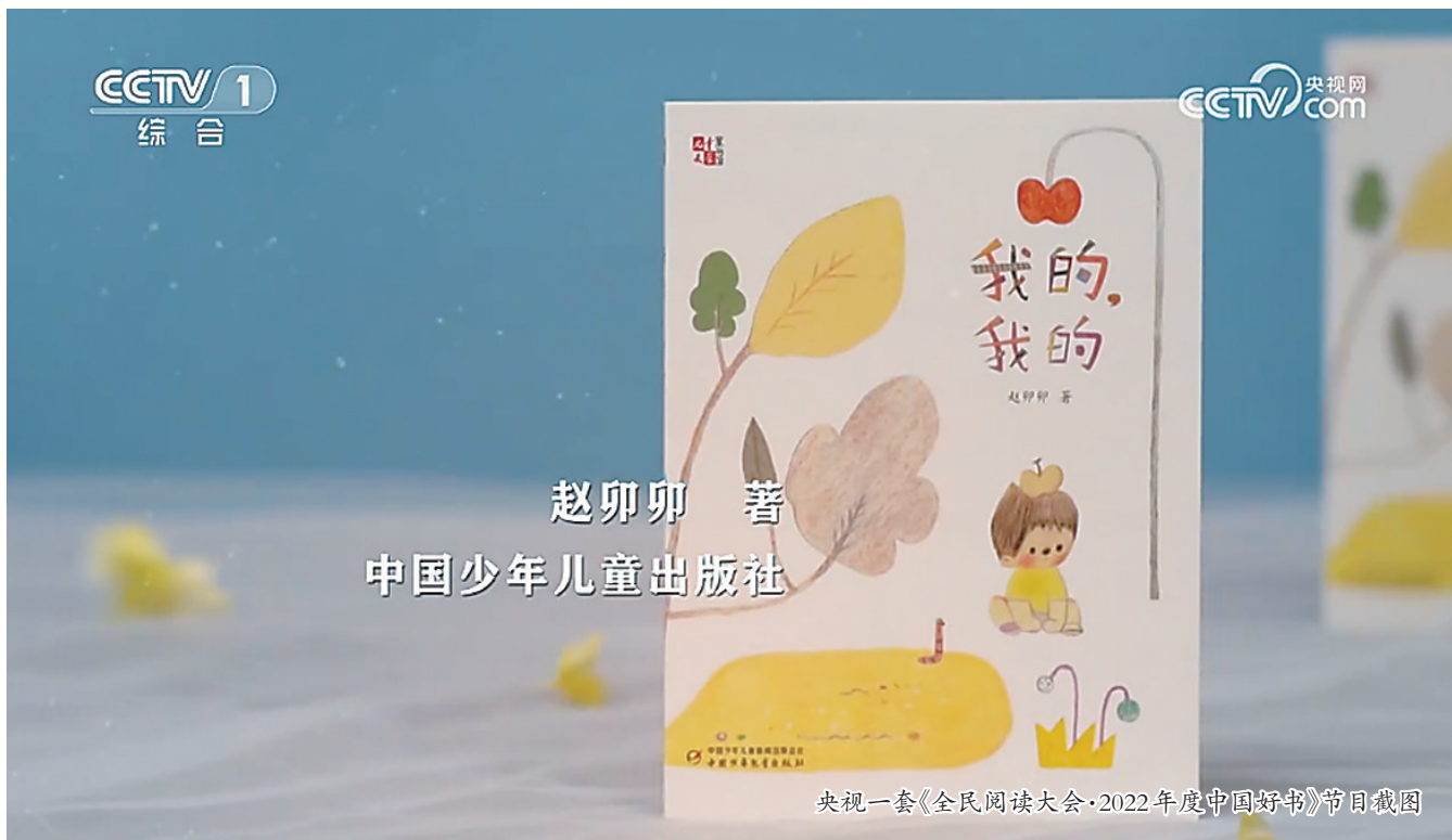
赵卯卯 著 中国少年儿童出版社

4月23日，我市作家赵卯卯凭借新作《我的，我的》斩获“文津图书奖”、《我的，我的》被评为“中国好书”，这是继3月24日她获第五届张天翼儿童文学奖长篇小说、童话奖之后再获殊荣。《我的，我的》由中国少年儿童出版社出版，作者赵卯卯原名赵立静，中国作家协会会员，海兴县人，曾出版图书《阿鲸的世界》《夕阳背后的世界》等。